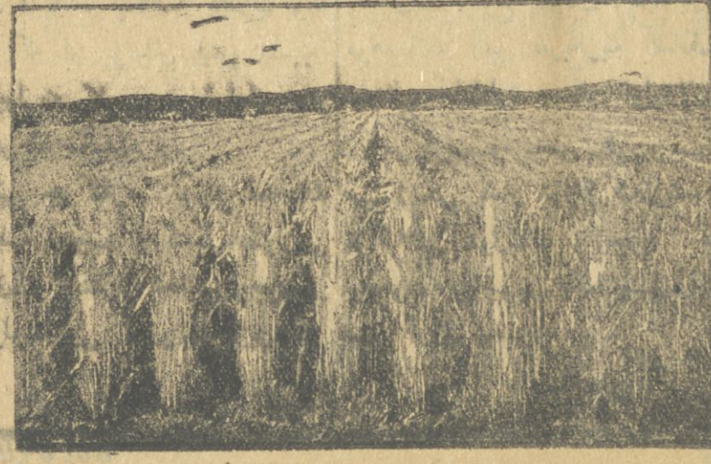
ماکنه ایله اکیلن تارلا باق گور نه باخشی کورستورلر

ماکنه ایله اکیلن تارلا باق گور نه باخشی کورستورلر. قلوب بوزنده تالان تخملر گوگر میوب سیجانلارا و قوشلارا یم اولیور و یا اینکه گوگره لرده یابک ایستی وقتلر نده تز قورورلار چونکه کوکلری تو پراقک اوست تاتنده بولنیور. چوق درینه دوشن تخملر ایسه کو کرمیرلر. کندچیلر بونلارک هاموسی تجربه ایله کورمش اولسالار کرک، اولنار کو کورمش اولسالارده درین یردن چتین لکه توپراق بوزنه چیقساندان صگره یک ضعیف قلوب باخشی باش دونمیرلر.