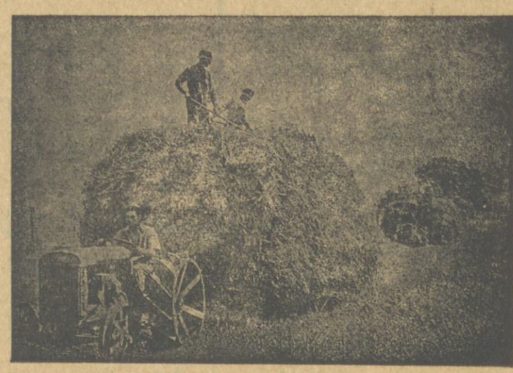
تراکتور ایله اوت آپاریرلر

اوت بیچن ماکنه 8-10 دھمە کندچینک ایشنی تیز گوریر و فاباغا آپاریر، بو ماکنه بەلیدر، بر آدمک ایشی دکل. برلشمەلی ماکنه جمعیتی تشکیل ایشلی و الە کتورمەلی.