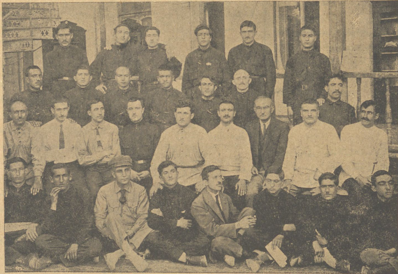
تخنیقومک ایلمک ماذونلریله معلملر هیئت

بو کون او ماذونلردن 20 سی، بوزلرینی کند دوغری جویره رک، حرکت ایتدیلر. کند معوطنده اولرک گوره جکی ایشلر و وظیفه لر یک بویوکدر. اولر یالکز مکبیده او کرندیک لرینی کند بالالارینه او کرتمکله اکتفا ایتمه جکلر. کندک بوتون ایشلرنده اجتماعی، فرقه وی بوتون قورولوش زحمتلرنده اولرک یاردیمی و زحمت بابی اولا جقدر. چونکه شورا تخنیقومنی قورتاران و قومونست تریه سی کورن بر جوانلر کندده یالکز مملکت ایچون کیتمه بور.