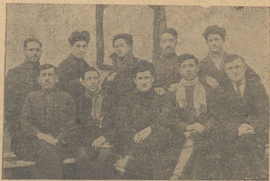
I- ايشاري ايشاري فرقه قوميه سئك مسؤل كاتبي بولداش اكبر رضيفدر

ويدياسار ناحيه سنده فرقه تشكياتي اولماسنه باقمياراق ايشلر او درجه ده ياخشي كيتميردي. بويله كه فرقه آراسنده فعاليتلر و نقصانلار نظره آينمياراق حتى فعال كندجي فرقه ويلر يمز ايشه سوق او لئابوب و اجتماعي ايشلره قوشولما بوب اوز فعاليتلر يني ترقي ايتديرمك دن تنزله وارد بريديلار. 26 نجي سنه نك نوبار آيندان اعتبارا ويدياسار ناحيه سنده آرتيق فرقه قوميه سي تشكيل اولندي. قو ميته نك عضولري ناحيه مزك فعال و مسؤل قومونستلري درلر. قوميه مز تشكيل اولونوب ايشه باشلا ياندان اوز فعاليتني كوسترمكده در. ناحيه ده ايكي ايدن آرتيق فرقه يه كيمك ايجون لايقي كندچيلر ك