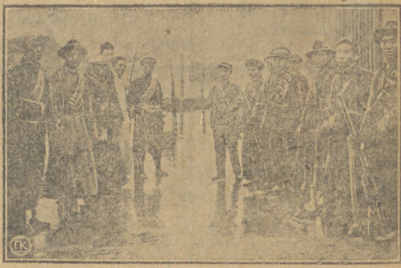
چین قرمزی قورادبانلاری

بوایل آذربایجانک بوتون رایون لرنده چول سیچانلاری چوغالمشدر.