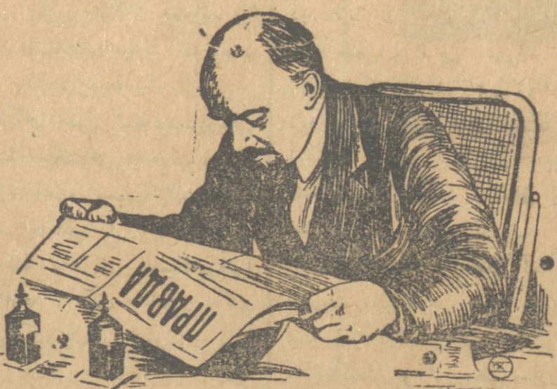
لهين و پراودا

لرى انقلابه حاضرلابوب همين انقلابى زحمتكش صنفى قازانديقدان سوگرا، بوگون يوز فائىز ايله اونك محافظه سنه، كئله لرك حاضرلانا سنه، قومونيزم مدنيتك نوريله او نلرك تعليم و تربيه كورمه لريته خد مت ايدر.