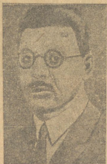
چان-تزو-لین طرفندن اعدام ایدیلن چین قوممونست فرقه سی په کین قو مینه کاتبی بولداش لی-تا-چاو

یادیکده می، آنجاق انقلابی اوزنه وظیفه بیله رنک اونک اوغورونده اولمکه حاضر بولندیغنی بیگا، بازبورنک ایندی ایسه بن سگا جواب یازبوریم. «بن آنجاق انقلابی تانیهرق بوندان سو کرا سنی آتا تانیه جتم. نه دن او تری قیاقچه سن بیگا ایشچی مبارزه سنک لاید لزومی باره سنده دانشاراق بی انقلابچی ایتك آرزوسنده ایدک. سنک ایندیگی ایشلرک اولجه دیدیک لرینیه و عمللرینه محافندر. لاکن بن سنک آرزو ایتدیگی ایضا ایتشم، بن انقلابچی اولشم اوندان اوتری ده سگا دوشمنم. چین خقنک سنک اوزرنده اولان اعتقادینی سن برینه بتورمه دک. چین کتله لری سنی سالملر ایله قارشولادی، سنی سو بوراردی لاکن سن اولنارک ایدینی برینه بتورمه دک، بو کون سن اولنارک دشمنی و عکس انقلابچیلرک قهرما نی» سک. محو اولسون چان-قای-شین. شاقه پیده سن ایشچیلری کوله له دیک، اونک ایچون بورژوا دنیاسی سنی آقیشیلاراق «باشا چان قای شی»