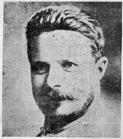
قرمزي اردو شکتياوتدي و رهبرلردين فروزه بولداش

اردو عکس اتقلاچي بوتون باندېترګ هر طرفدن باغان جھولارني داغيتدي و کيږو پوسکوندي. عائيت اونګه تامين اونلندي که «قرمزي اوردوه [شايدان] حيرت بر پارزه پروله تاريا رهبريتنګ محکم ليکي فلهلر ايله زحمتګر کدلي لړلک [استمارچيلار عليهنده اولان] اتقاي (برليکي) ايله تطبيق اولمش ايډي. (لهين). قرمزي اردو پوهنه پرا حکمراننګ سفی اردوسی اولراق عا ل کشفدر.