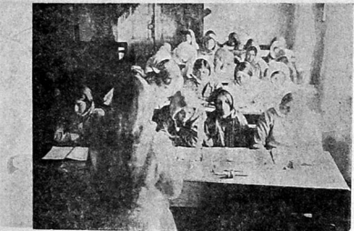
Kilyb nəzdində turq kadınları, savad kyrsında dərs okıyırqan

varid olmyşlar. Əmma by orçylıq Məhərd ad dən sonra başqa rəngə sokanılır heç əziyəti dıyan qərmürəq, dıyanlar jənə asəqi sınıf dur. Aza qı sınıf jykart sınıfdan zulum həkərat qərorəqan Məhəmmədə sərtolını həkərat edənə cəhənnəmi byjyrır. Və o cəhənnəmə xəlk qəz dı-qəraq mə'nəvi vətıqlıqı byryzəyja by karışt alımdır. Orç ydymak jani qunda (18) sahat ac-sysz kalmak şühət üçün