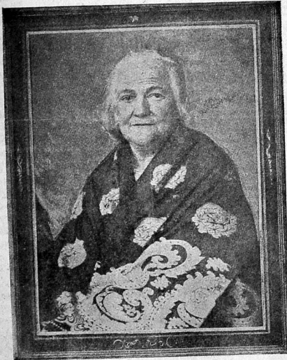
Kominternin İcrəyi Komitəsinin Bejn-əl xəlkə kadın sekretərijatının Cenraninin, qatibli və MoPrn Mərqəzi komitəsi sədri joldas Klaratsetqin

Zyra hequmət, kadın təməmi əzədləq verəbilməqdən ətəri, məq tablər, kyrsilər və əzqə vastələrə kadın, bizim imymı əyri zəhmət-