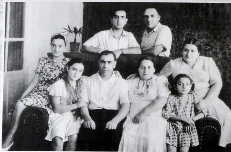
1947 Баки - Баку - Баки