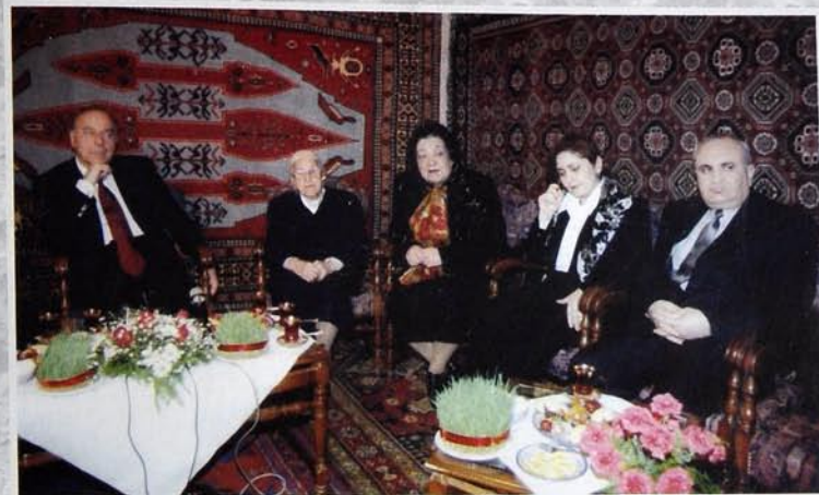
2001 Баки - Баку - Баки