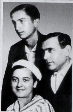
1938 Əziz Əliyev, oğlu Tamerlan və qızı Zərifə xanım. Aziz Aliyev, сын Тамирлан и дочь Зарифа ханум. Aziz Aliyev, his son Tamerlan and his daughter Zarifa khanum