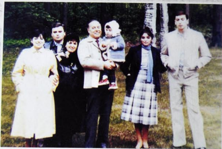
ZƏRİFƏ XANIM AİLƏSİ İLƏ BİRLİKDƏ ЗАРИФА ХАНУМ В КРУГУ СЕМЬИ ZARIFA KHANUM WITH HER FAMILY