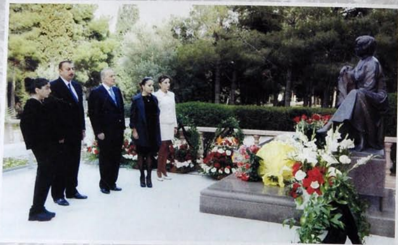
Ulu Öndər Heydər Əliyev öz ailəsi ilə Zərifə Əliyevanın məzarını ziyarət edərkən. Общенациональный Лидер Гейдар Алиев с членами семьи во время посещения могилы Зарифы Алиевой. National leader Heydar Aliyev with his family visiting cemetery of Zarifa Aliyeva.