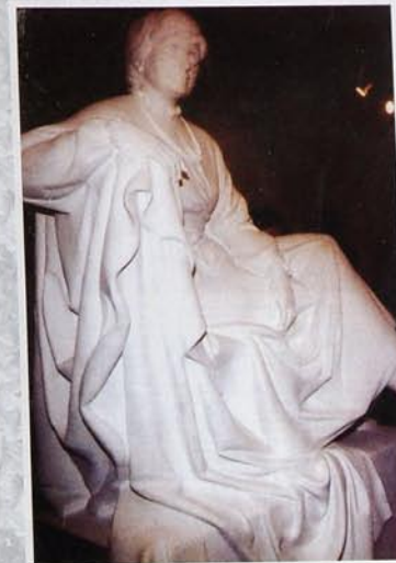
1997 «Elegiya». «Элегия». «Elegy» Heykəltəraş Ömər Eldarov. Скульптор Омар Эльдаров. Sculptor Omar Eldarov.