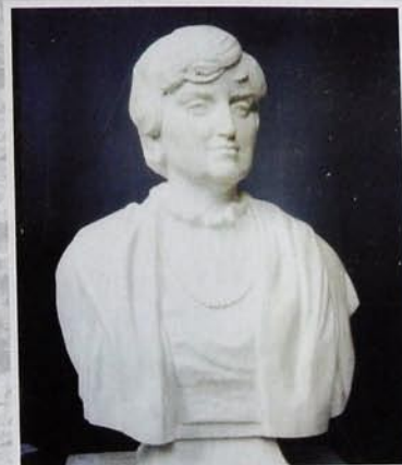
Büst 2003-cü ildə akademik Zərifə xanım Əliyevanın 80 illiyində Z. Ə. Əliyeva adına Elmi-Tədqiqat Göz Xəstəlikləri İnstitutunun kollektivinin sifarişli ilə hazırlanmışdır. В 2003-м году по заказу НИИ глазных болезней им. З. А. Алиевой по случаю 80-летия был изготовлен бюст академика Зарифы ханум Алиевой. In 2003 Research Institute of Eyes Diseases named after Z.A.Aliyeva ordered to make bust of academician Zarifa khanum Aliyeva devoted to 80th anniversary of Z.A.Aliyeva.