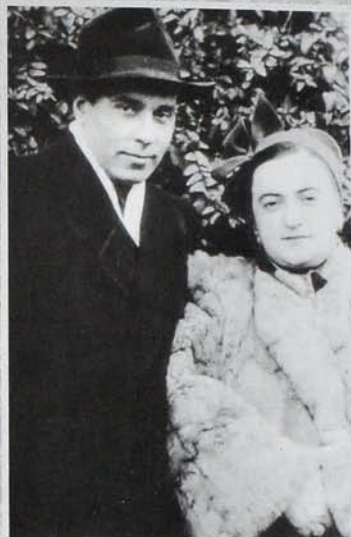
ZƏRİFƏ XANIM VƏ HEYDƏR ƏLİYEV ЗАРИФА ХАНУМ И ГЕЙДАР АЛИЕВ ZARIFA KHANUM AND HEYDAR ALIYEV