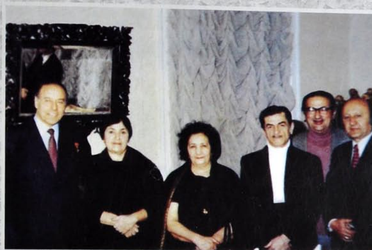
HEYDƏR ƏLİYEV VƏ ZƏRİFƏ XANIM MƏDƏNİYYƏT XADİMLƏRİ İLƏ GÖRÜŞƏRKƏN ВСТРЕЧА ГЕЙДАРА АЛИЕВА И ЗАРИФЫ ХАНУМ С ДЕЯТЕЛЯМИ КУЛЬТУРЫ HEYDAR ALIYEV AND ZARIFA KHANUM AT THE MEETING WITH PERSONS OF CULTURE