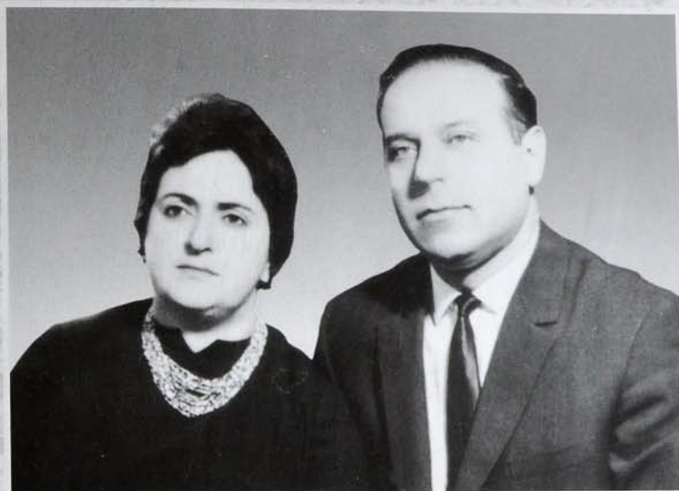
ZƏRİFƏ XANIM VƏ HEYDƏR ƏLİYEV ЗАРИФА ХАНУМ И ГЕЙДАР АЛИЕВ ZARIFA KHANUM AND HEYDAR ALIYEV