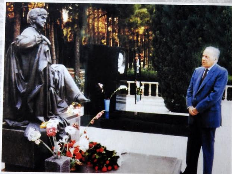
Ulu Öndər Heydər Əliyev Zərifə xanımın məzarını ziyarət edərkən. Общенациональный Лидер Гейдар Алиев во время посещения могилы Зарифы ханум. National leader Heydar Aliyev at cemetery of Zarifa khanum.