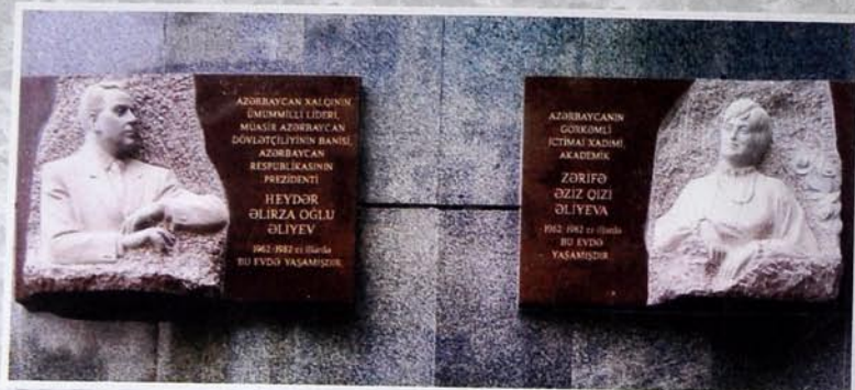
Ulu Öndər Heydər Əliyevin və akademik Zərifə xanım Əliyevanın yaşadıqları binadakı baryeflər.

Барельефы Общественного Лидера Гейдара Алиева и академика Зарифы ханум Алиевой на фасаде дома, в котором они жили. Bas-reliefs of national leader Heydar Aliyev and academician Zarifa khanum Aliyeva on front of building where they lived.