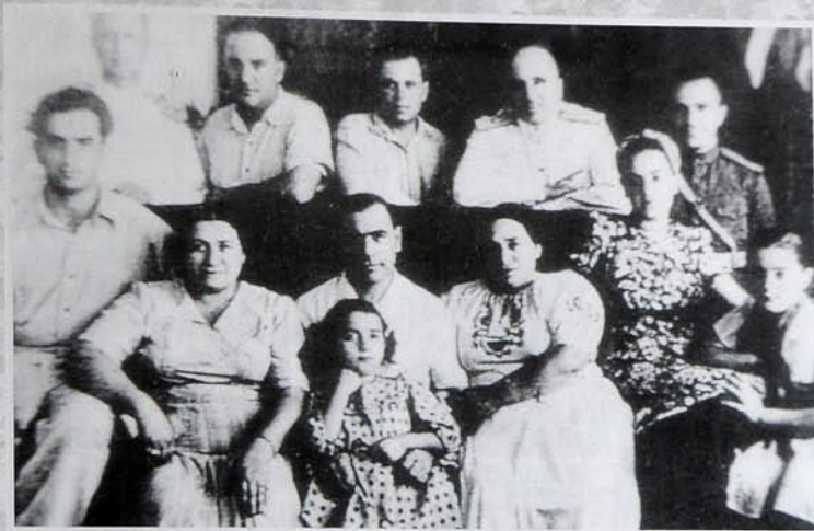
1945 Əziz Əliyevin ailəsi (birinci sırada sağdan ikinci Zərifə xanım). Семья Азиза Алиева (в первом ряду вторая справа Зарифа ханум). Aziz Aliyev's family (Zarifa khanum: the first row, the second to right).