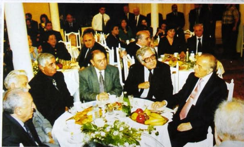
2000 Akademik Zərifə xanım Əliyevanın xatirə günü. Вечер памяти академика Зарифы ханум Алиевой. Party to memory of academician Zarifa khanum Aliyeva.