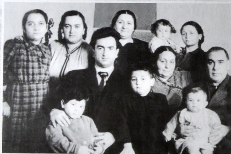
1953 Баки - Баку - Баки