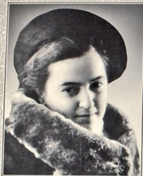
ZƏRİFƏ XANIM ƏLİYEVƏ ЗАРИФА ХАНУМ АЛИЕВА ZARIFA KHANUM ALIYEVA