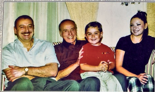
Ulu Öndər Heydər Əliyev ailəsi ilə. Общациональный Лидер Гейдар Алиев в кругу семьи. National leader Heydar Aliyev with his family.