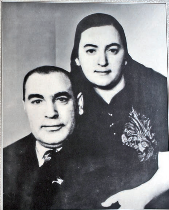
ZƏRİFƏ XANIM VƏ ATASI ƏZİZ ƏLİYEV ЗАРИФА ХАНУМ С ОТЦОМ, АЗИЗОМ АЛИЕВЫМ ZARIFA KHANUM AND HER FATHER AZIZ ALIYEV

In spite of the fact that Zarifa khanum Aliyeva has left us, the light memory of her will never grow dim. This light is always with us, it will eternally live in sad memoirs, in children and grandsons.