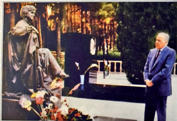
Ulu Öndər Heydər Əliyev Zərifə xanımın məzarını ziyarət edərkən. Общественный Лидер Гейдар Алиев во время посещения могилы Зарифы ханум. National leader Heydar Aliyev at cemetery of Zariifa khanum.