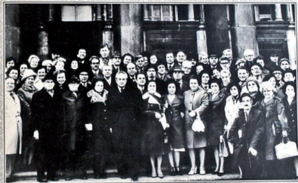
1977 Ofthalmoloqların Ümumittifaq Konfransı. Bakı. Всесоюзная Конференция Офтальмологов. Баку. All-Union Conference of Ophthalmologists. Baku.