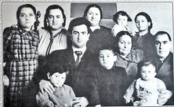
Ваки - Баку - Ваку