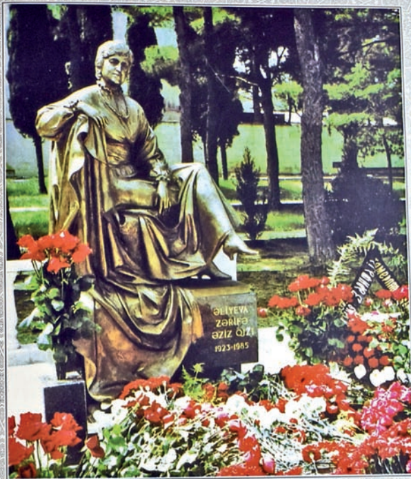
1997 «Elegiya». Zərifə xanım Əliyevanın heykəl portreti. Heykəltəraş Omər Eldarov. «Элегия». Скульптурный портрет Зарифы ханум Алиевой. Скульптор Омар Эльдаров. «Elegy». Sculptural picture of Zərifə xanum Aliyeva. Sculptor Omar Eldarov.