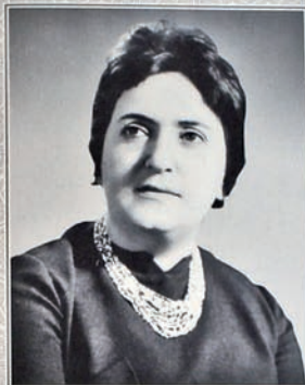
ZƏRİFƏ XANIM ƏLİYEVƏ ЗАРИФА ХАНУМ АЛИЕВА ZARIFA KHANUM ALIYEVA