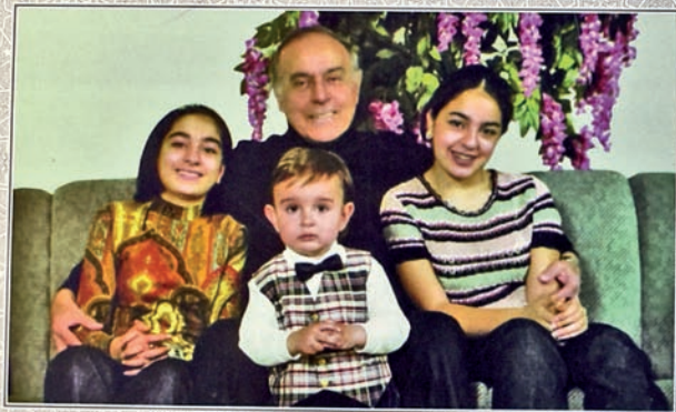
Ulu Öndər Heydər Əliyev nəvələri Leyla, Arzu və Heydər ilə. Общациональный Лидер Гейдар Алиев с внуками Лейлой, Арзу и Гейдаром. National leader Heydar Aliyev with his grandchildren: Leyla, Arzu and Heydar.