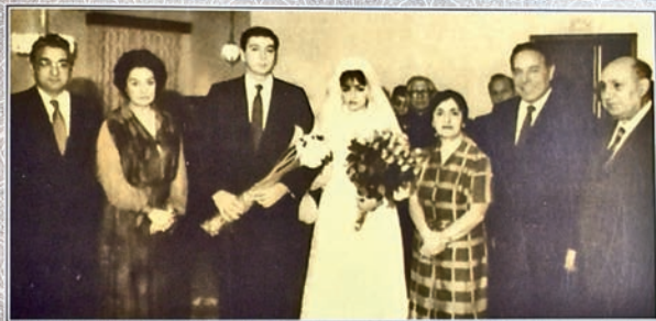
Ilham Əliyev ilə Mehriban xanımın nişan mərasimi. Обручение Ильхама Алиева с Мехрибан ханум. Engagement of Ilham Aliyev with Mehriban khanum.