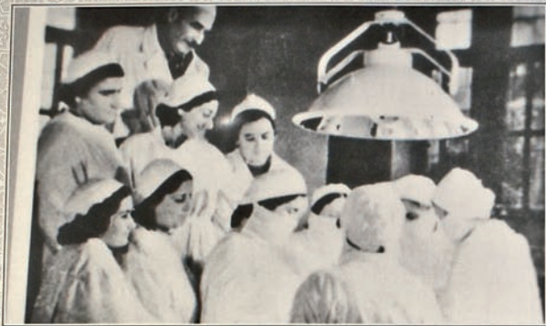
1957 Əməliyyat zamanı. Во время операции. During operation.