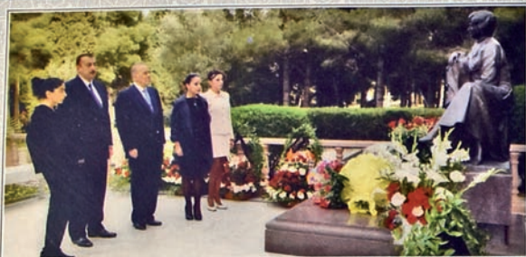
Ulu Öndər Heydər Əliyev öz ailəsi ilə Zərifə Əliyevanın məzarını ziyarət edərkən. Общественный Лидер Гейдар Алиев с членами семьи во время посещения могилы Зарифы Алиевой. National leader Heydar Aliyev with his family visiting cemetery of Zariifa Aliyeva.