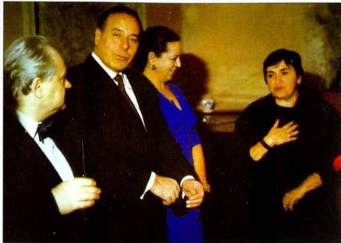
Zorifə və Heydər Əliyevlər Rusiyada Azərbaycan musiqi mədəniyyəti xadimlərini qəbul edir, 1981-ci il.