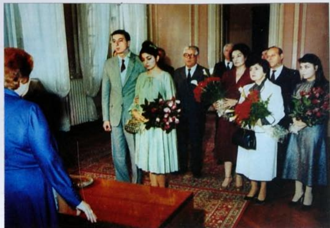
İlham Əliyev və Mehriban xanımın nişanı, 1982-ci il.