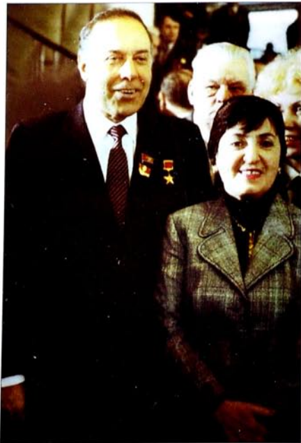
Zorifə və Heydər Əliyevlər, 1981-ci il.