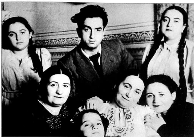
Əziz Əliyevin ailəsi, 1947-ci il.