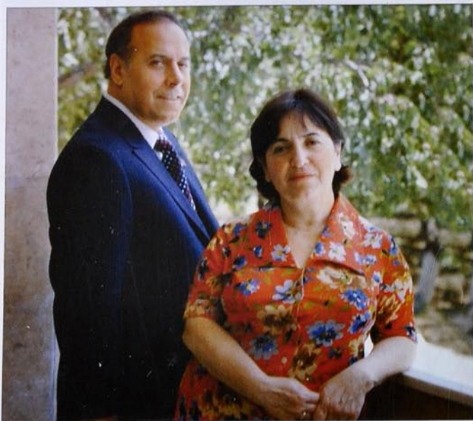
Zərifə və Heydər Əliyevlər, 1984-cü il.