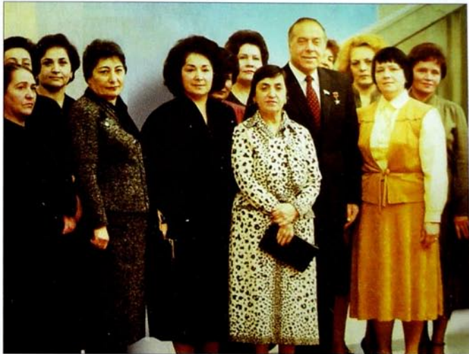
Zorifə və Heydər Əliyevlər respublika alimləri ilə, 1982-ci il.