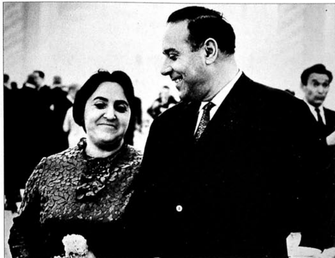
Zərifə xanım Əliyeva və Heydər Əliyev oftalmoloqlar konfransında, oktyabr 1977-ci il.