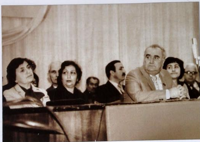
Zərifə xanım Əliyeva Əziz Əliyev adına Azərbaycan Həkimlərin Təkmilləşdirilməsi İnstitutunda Əziz Əliyevin yubileyinə həsr edilmiş təntənəli yığıncaqda, 1982-ci il.