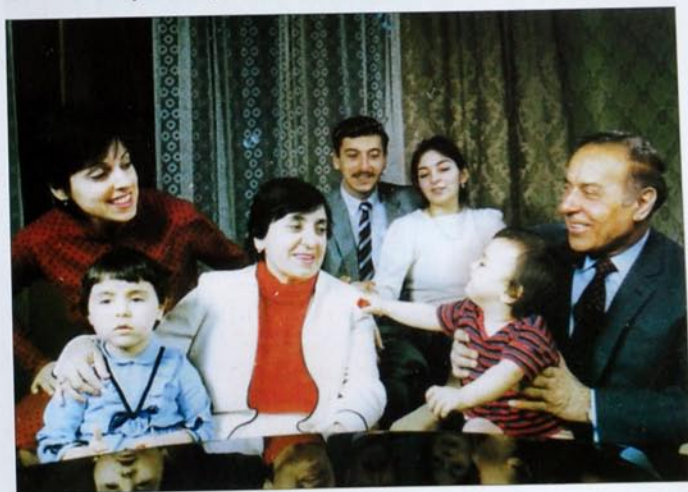
Zərifə və Heydər Əliyevlər ailəsi ilə, 1983-cü il.