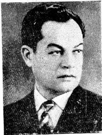
Республиканын халг артисти Мехди МЭММЭДОВ