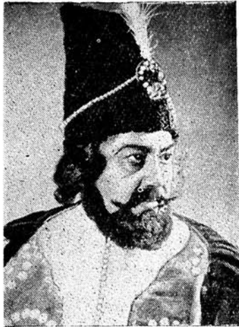
Республиканын халг артисти Агабаба БУНЖАДЗАДЕ