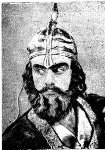
Республиканын эмекдар артисти Чаваншир ГАФАРОВ