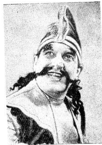
Республиканын эмекдар артисти Казым МӘММӘДОВ