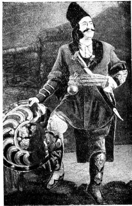
ССРИ халг артисти, Дөвлэт мукафаты лауреаты БҮЛБҮЛ

Мэни «Короглу» операсы чох-чох севиндирир. Бу опера, Азербайчан халгынын бөјүк гэһрэманыг дастаны олан Короглуны нэслимизэ бэдиш бир шэкилдэ көстэрир.