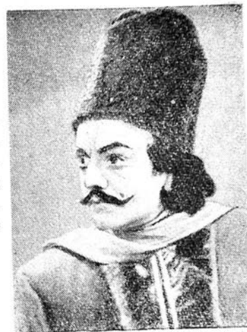
Республиканын әмәкдар артисти Лүтфијар ИМАНОВ