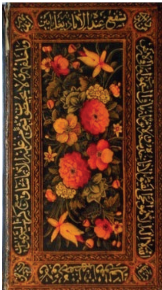
Naməlum rəssam və xəttat . Təbriz. XIX əsr . Quran. Karton, kağız ,qara mürəkkəb, qızıl suyu, lak, tempera. Q-3147