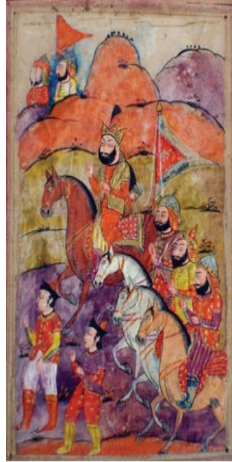
Naməlum rəssam Hindistan XVIII-XIX əsr Nizami Gəncəvinin "İsgəndərnamə" əl yazmasına illüstrasiya. 28 x 20 Karton, kağız. Tempera Q-1801/1.4