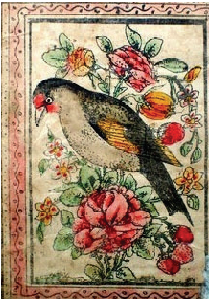
Mir Mhsun Nvvab (1833-1918) "Blbl v qızılgl " lyazma kitabı. 1903 il. ( 1310-hicri ) 14,8 x 22,2 K Kağız, sulu boya,tuř Q-2927