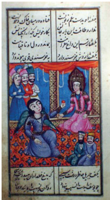
Naməlum rəssam və xəttat. Azərbaycan, Təbriz, (Qacar üslubu). Əbdürrəhman Cami "Yusif və Züleyxa" əlyazma kitabı. XIX əsr. 18 x 11 x 2 tempera, tuş Q-1859