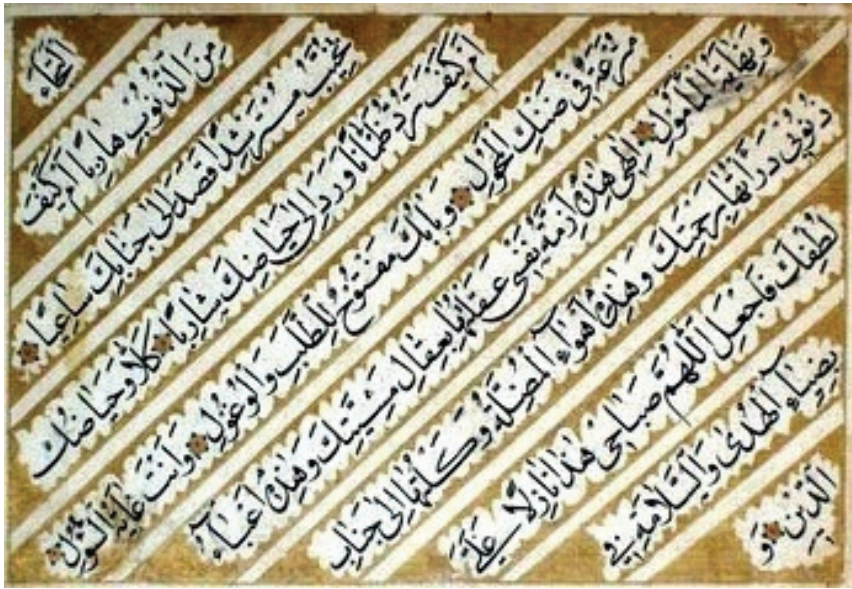
Naməlum xəttat. Əlyazma nümunəsi. . Azərbaycan. XIX əsr 8,5 x 13,5 qızıl suyu,tuş Q-2641