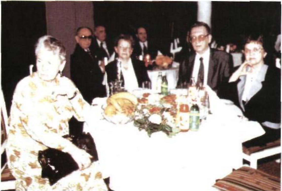
Xatirə gecəsi - 1995-ci il