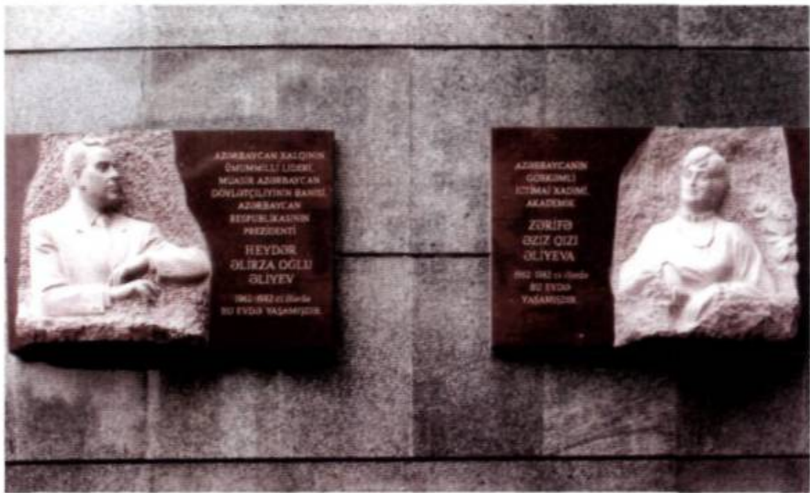
Ulu Öndər Heydər Əliyevin və akademik Zərifə xanım Əliyevanın yaşadığı binadakı büstləri.