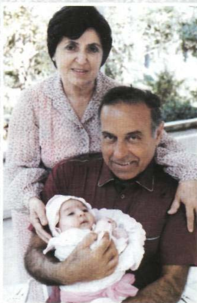
Zərifə xanım və Heydər Əliyev nəvələri Leyla ilə - 1984-cü il.