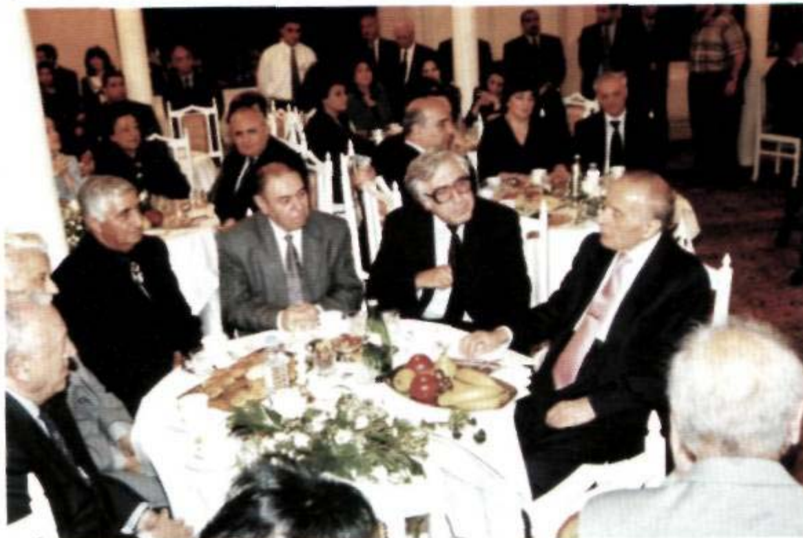
Akademik Zərifə xanım Əliyevanın xatirə günü. 2000-ci il.