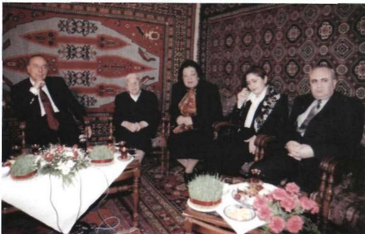
Bakı, 2001-ci il.