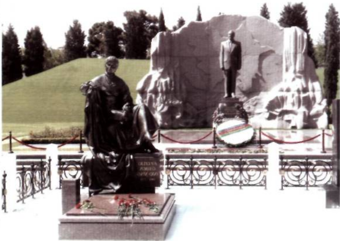
Fəxri Xiyaban. Ulu Öndər Heydər Əliyevin və akademik Zərifə xanım Əliyevanın məzarları.