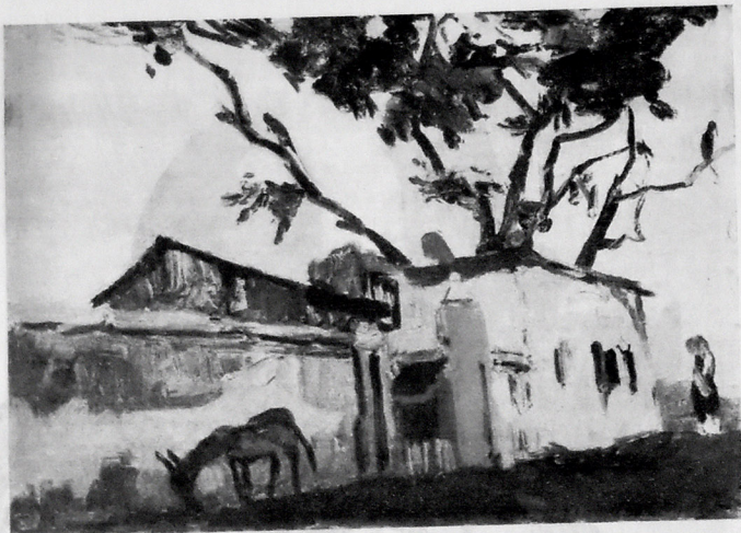
KƏLKÜTTƏ ƏTRAFINDA. 1957. KARTON, YAĞLI BOYA. 24 X 35.