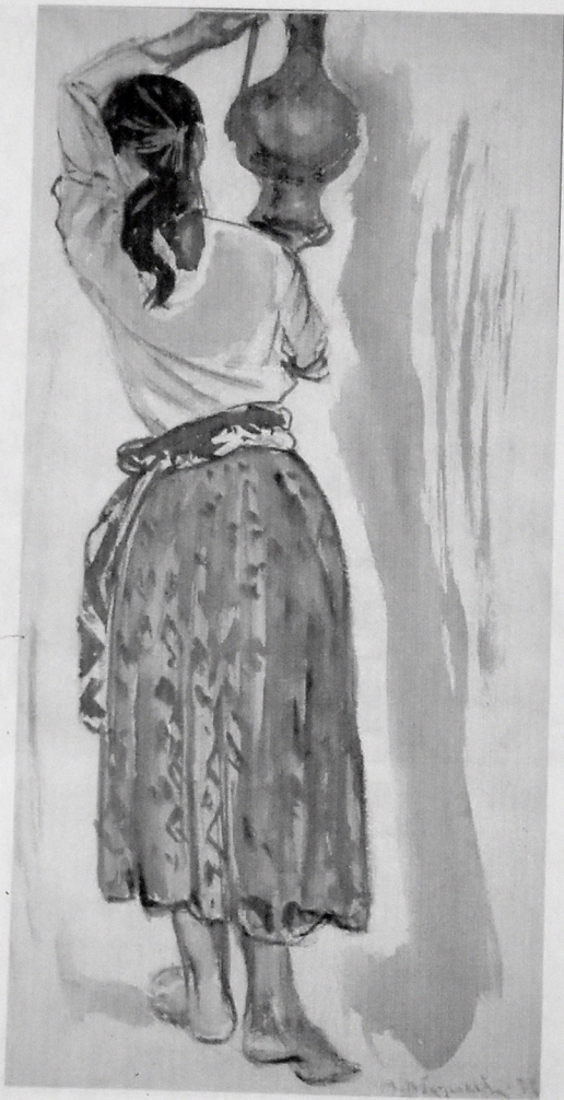
SƏHƏNG APARAN QIZ. AKVAREL, 28X35.