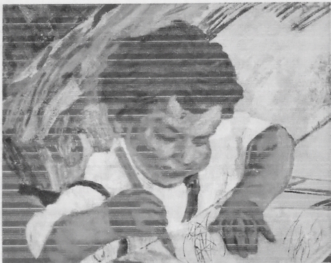
BALACA CAMİ. 1965. KƏTAN, YAĞLI BOYA, 65X50.