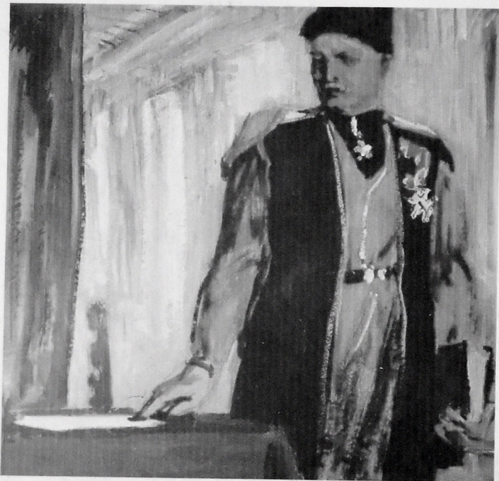
AZƏRBAYCAN ŞAİRİ VƏ YAZARI M. F. AXUNDOV.