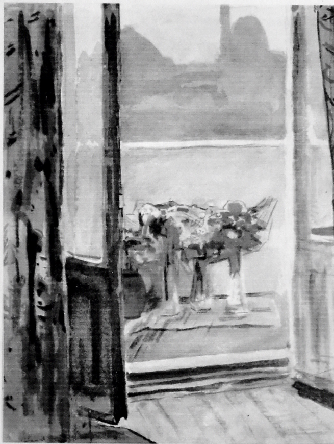
EYVANDAN GÖY MƏSCİDƏ AÇILAN MƏNZƏRƏ. 1966. AKVAREL, 45X60.