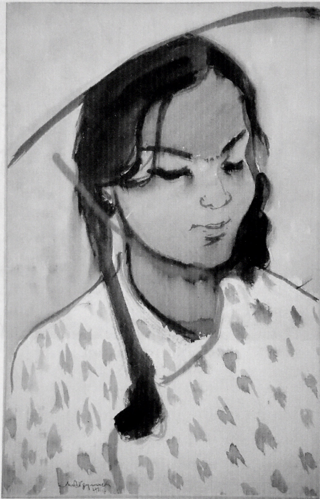
VYETNAMLI QIZ. 1971.