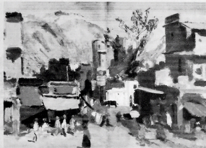
CAYPURDA SƏHƏR. 1957. KƏTAN, YAĞLI BOYA, 35X39.