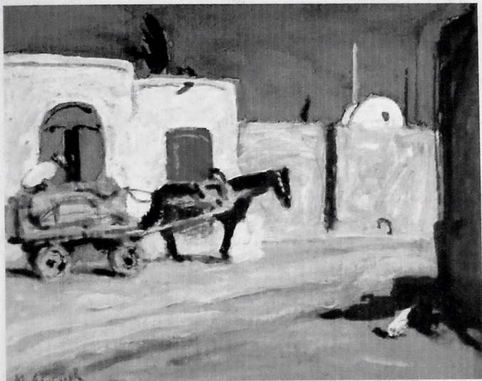
KÖHNƏ ŞƏHƏR. AKVAREL, 28X22.