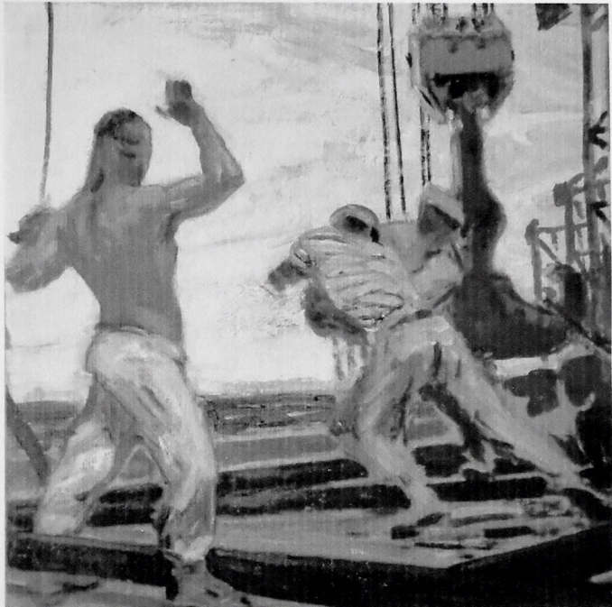
XƏZƏR NEFTÇİLƏRİ. 1971. KARTON, QUAŞ, 40X38.