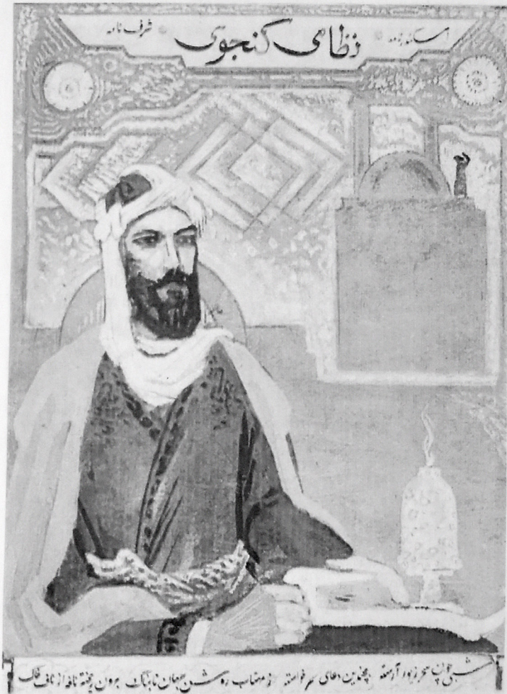
NİZAMİ GƏNCƏVİ. 1980.