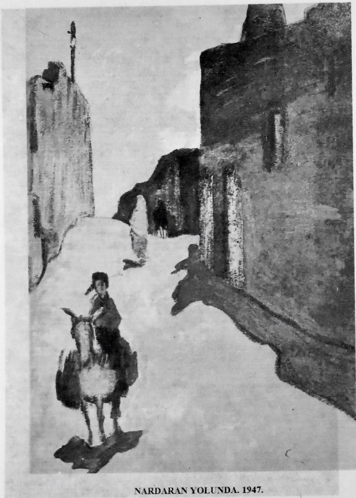
NARDARAN YOLUNDA. 1947.