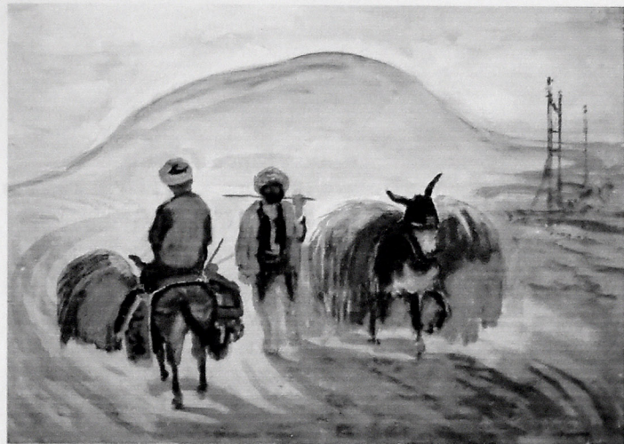
OT BİÇİNİ. 1983-1985. AKVAREL, 98X74.