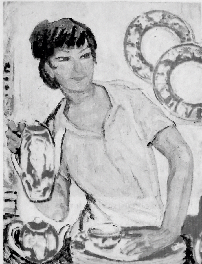
SƏMƏRQƏND ÇİNİSİ. 1980.