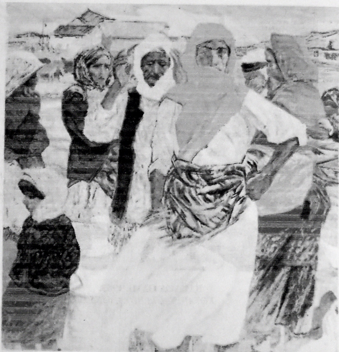
1941-Cİ İLİN İYUNU. 1964-1965.