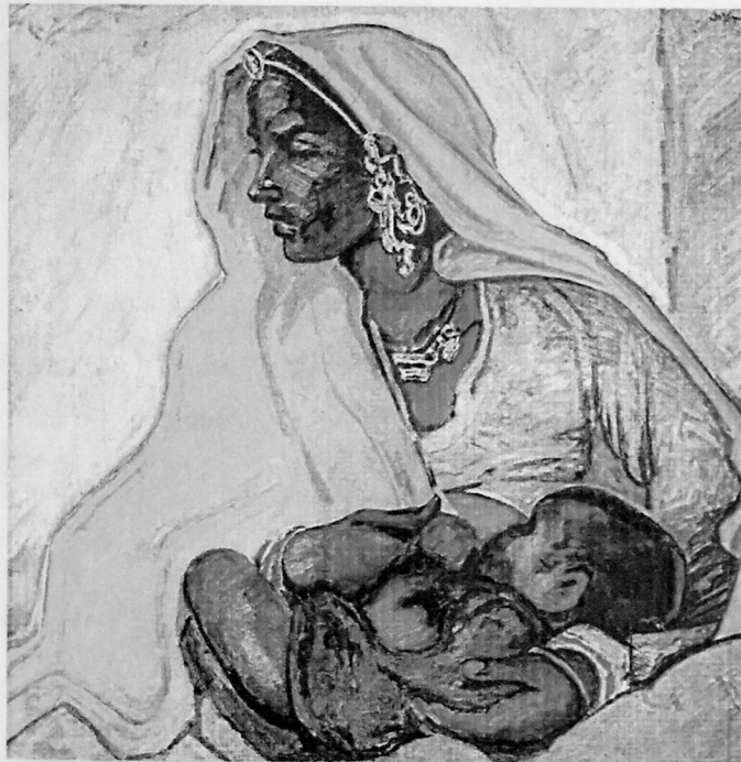
ANA HİNDİSTAN. 1972. KƏTAN, YAĞLI BOYA, 118X124.