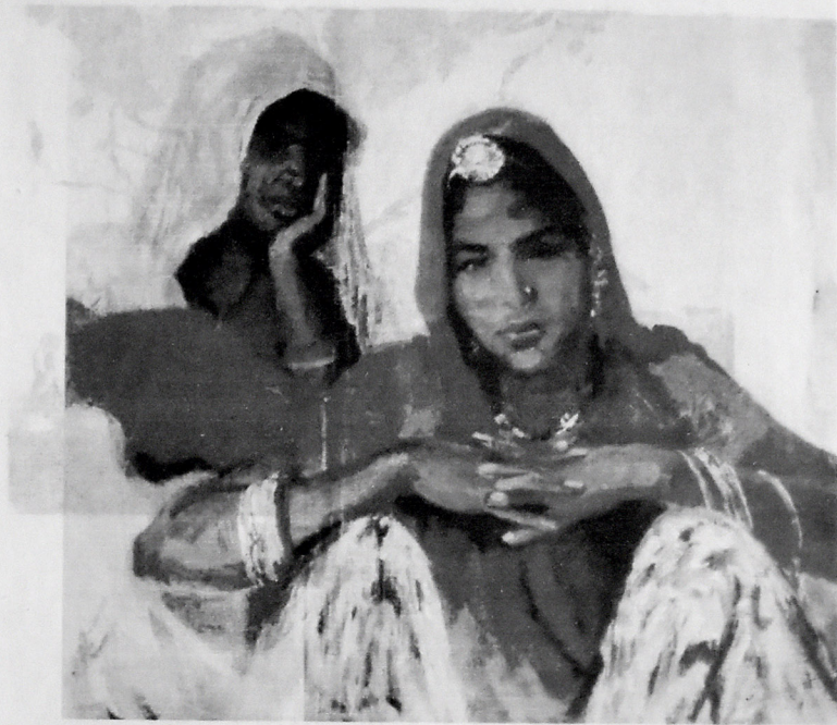
CAYPUR QADINLARI. 1957.