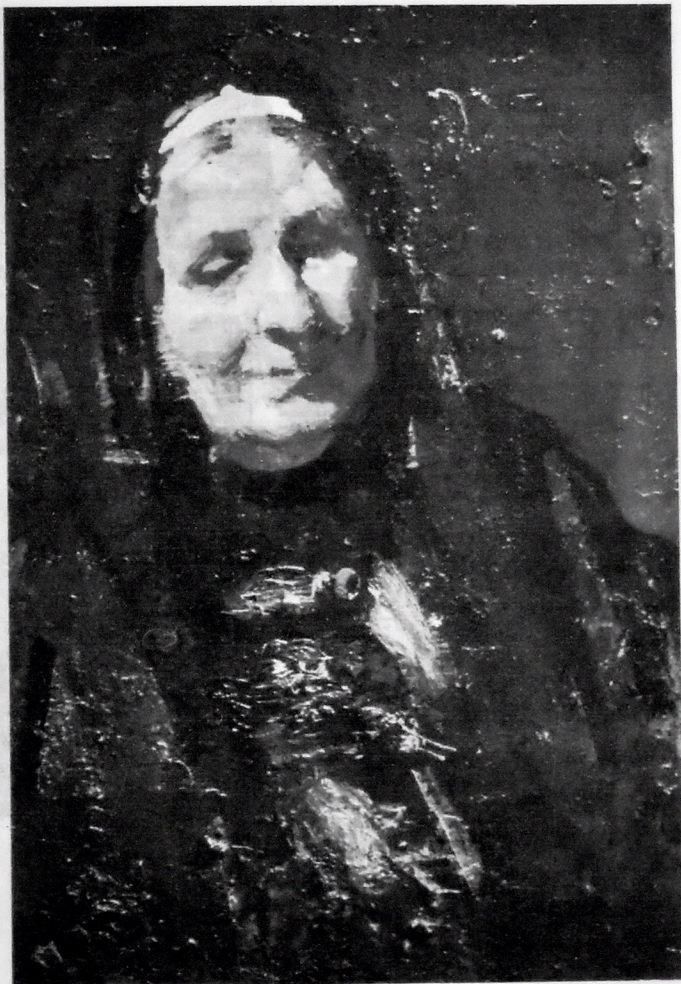
RƏSSAMIN ANASI. FANER, YAĞLI BOYA, 22X32.