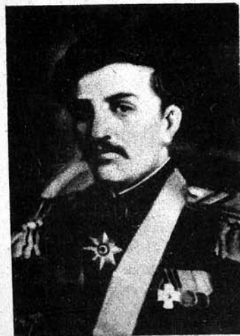
Bakixanov Abbasquluğa Mirzə Məhəmməd oğlu (1794—1847)—Azərbaycan alimi, şair, maarifpərvər. Bakı xanı II Mirzə Məhəmmədin oğludur.

Qarabağın ərazisində iki xanlıq—Qarabağ və Gəncə xanlıqları yarandı. Qarabağın hüdudları cənubdan-Araz çayı, şərqdən Kür çayı, şimaldan Goran çayı, qərbdən Küşbək, Salvartı və Ərikli dağları idi.