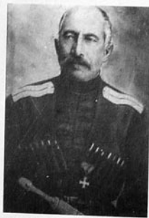
Həsənəli bəy Əskərxanov