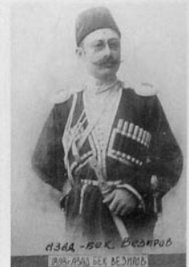
Azad bəy Vəzirov