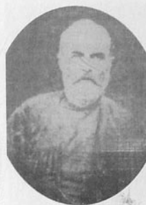
Əhməd bəy Cavanşir