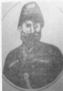
Cəfərqulu xan Nəva