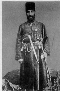
Cəfərqulu xan Cavanşir