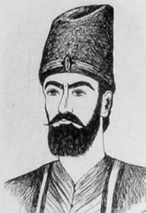
İbrahimxəlil xan Cavanşir