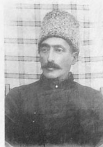
Qacar Kamran mirzə