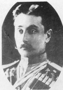
Mehdiqulu xan Usmiyev