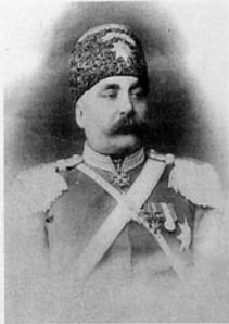
Qacar Şahrux mirzə