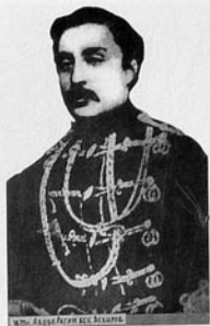
Əbdürrəhim bəy Vəzirov