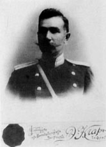
Qacar Qulamşah mirzə