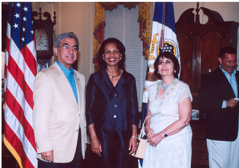
AQSH Davlat kotibi Kondoliza Rays tomonidan uyushtirilgan Mustaqillik kuniga bag'ishlangan qabul marosimida Ra'no xonim bilan (4-iyul 2006–yil)