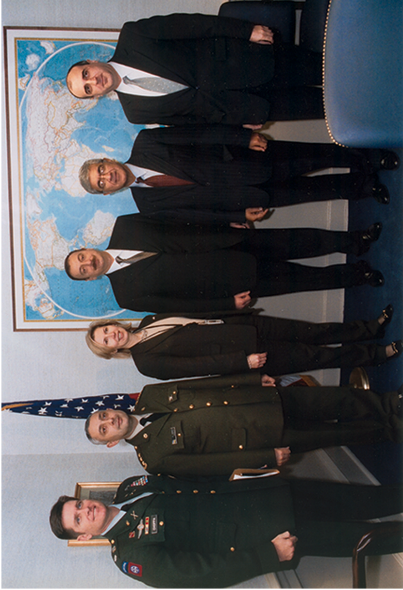
Prezident Ilhom Aliyev Pentagon yig'ilishida