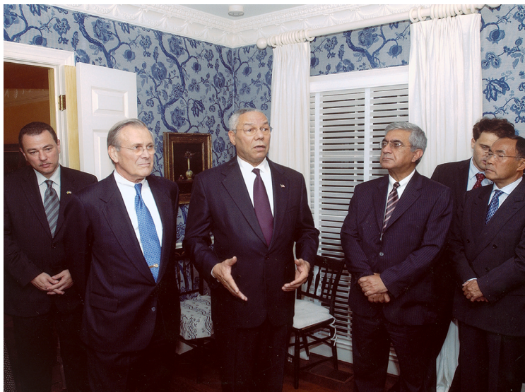
AQSH Mudofaa vaziri Donald Ramsfeldomning qabulida Davlat kotibi Kollin Pauell janoblarining nutqi (2004–yil)