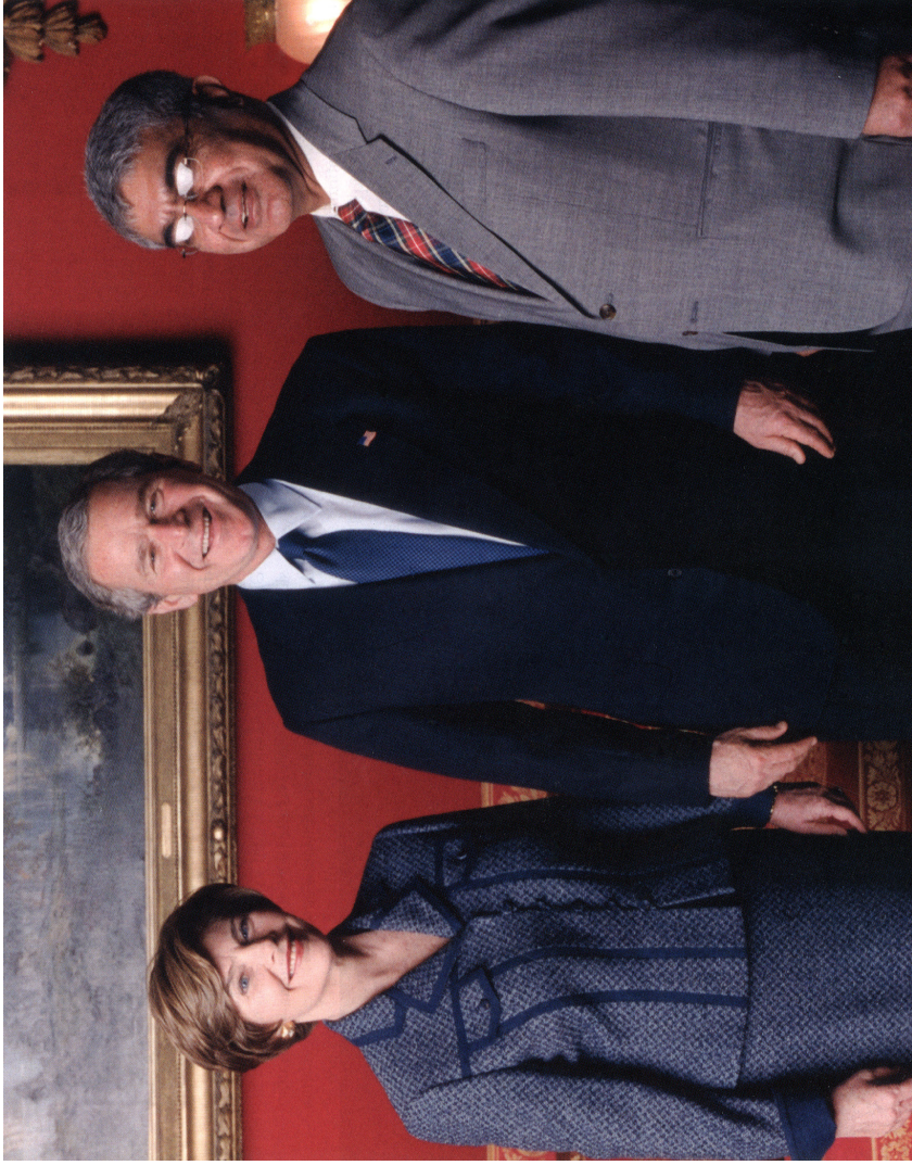
AQSH Prezidenti Jorj Bush va ayoli Lara xonim bilan (2002–yil)