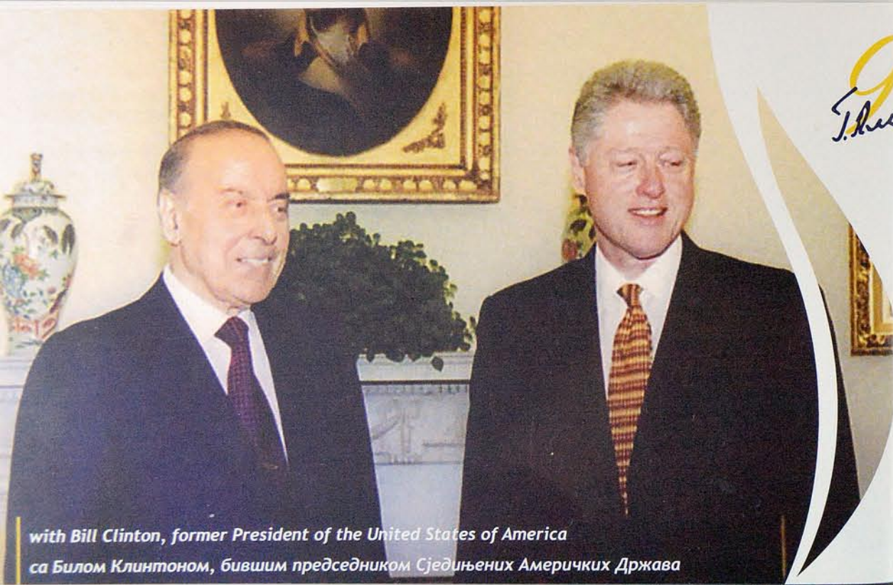
with Bill Clinton, former President of the United States of America са Билом Клинтоним, бившим председником Сједињених Америчких Држава