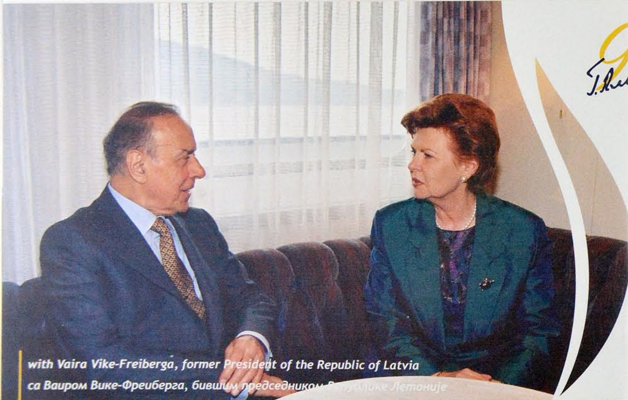
with Vaira Vike-Freiberga, former President of the Republic of Latvia са Ваиrom Вике-Фреиберга, бившим председником Републике Летоније