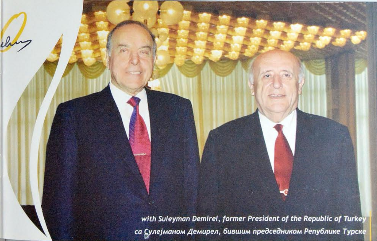
with Suleyman Demirel, former President of the Republic of Turkey са Сулејманом Демирел, бившим председником Републике Турске