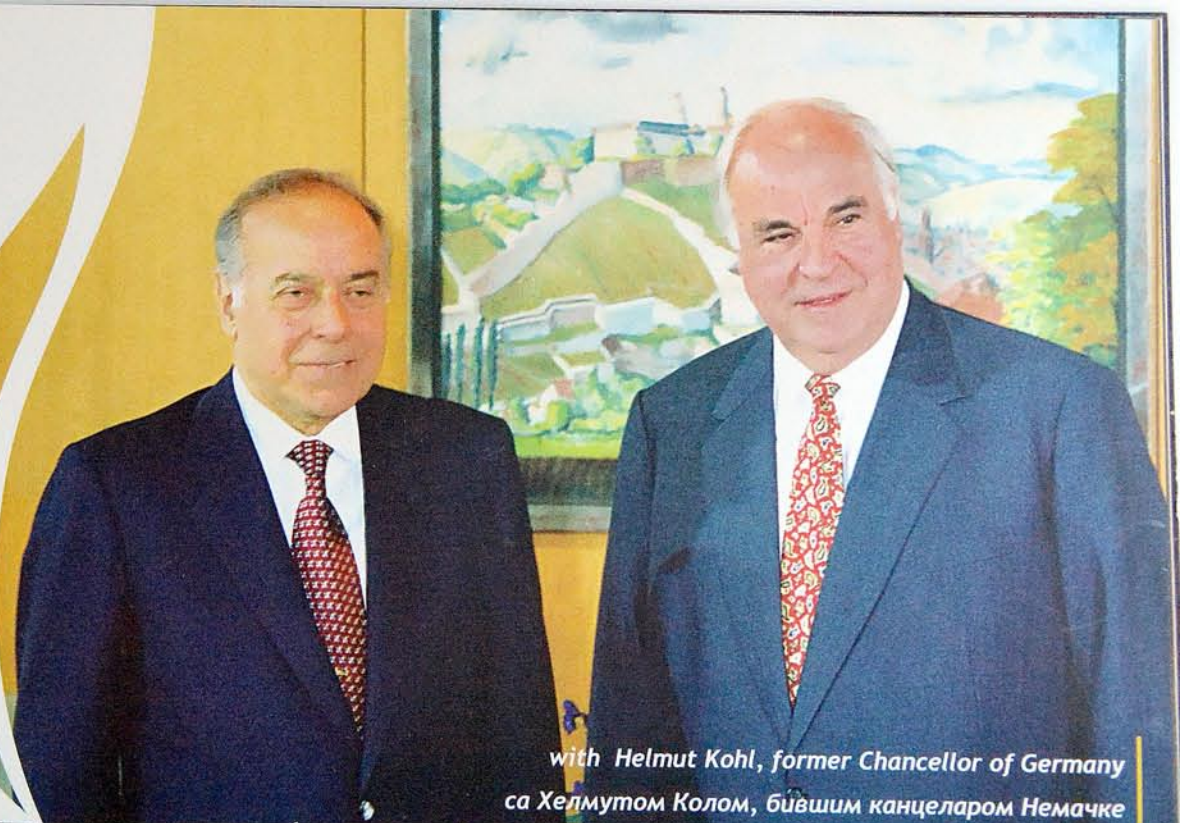
with Helmut Kohl, former Chancellor of Germany са Хелмутом Колом, бившим канцеларом Немачке