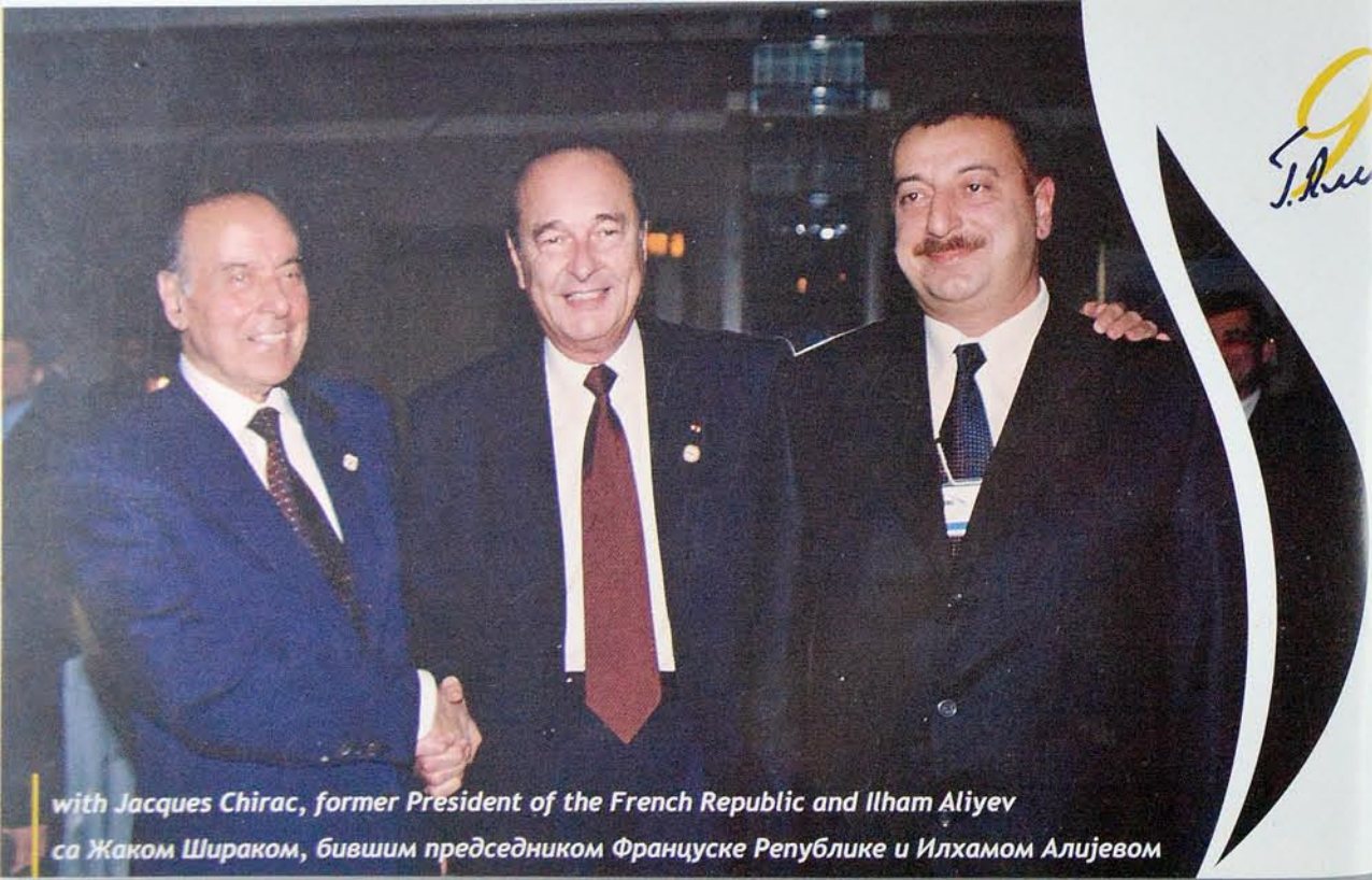
with Jacques Chirac, former President of the French Republic and Ilham Aliyev са Жаком Шираком, бившим председником Француске Републике и Илхамом Алијевом