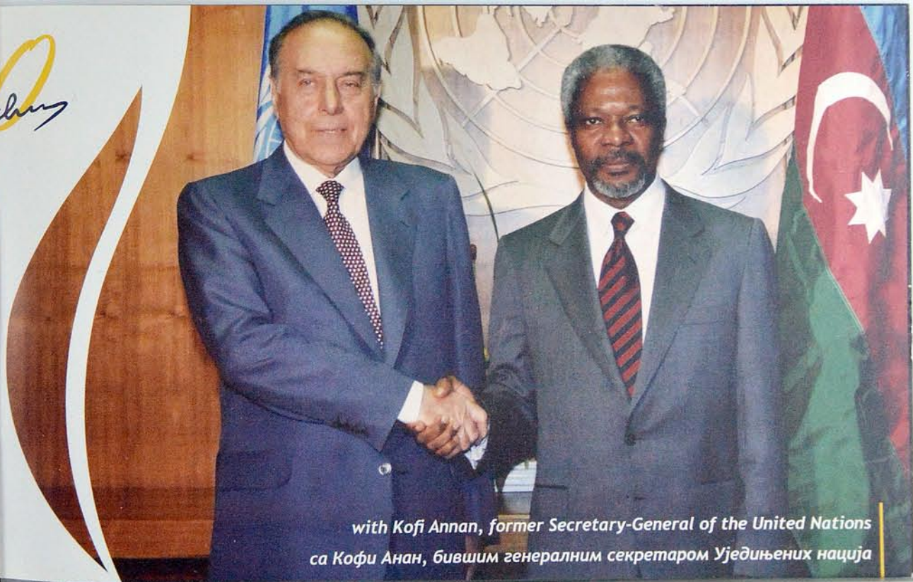
with Kofi Annan, former Secretary-General of the United Nations са Кофи Анан, бившим генералним секретаром Уједињених нација