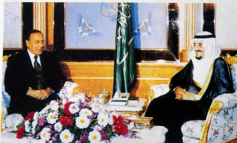
«Şərq-Qərb» Bakı – 2010