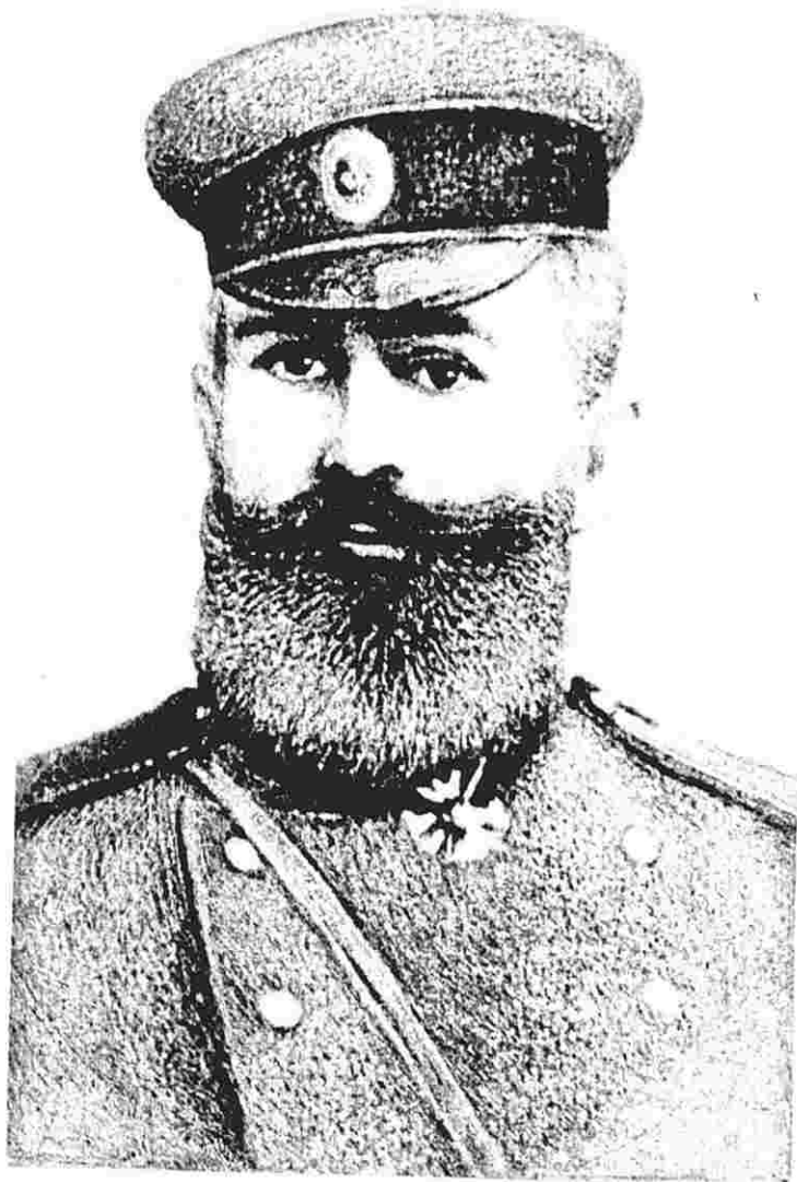
С.С.Мехмандаров - генерал-от-артиллерии.

Военный министр генерал-от-артиллерии Мехмандаров ГААР, ф.2894, оп.6, д.2, л.4. Заверенная копия.