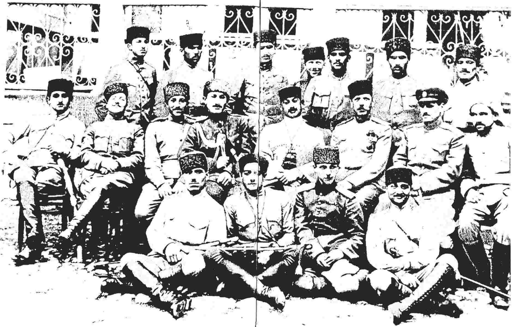
Офицеры азербайджанской армии. 1918 г.