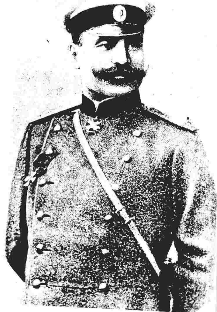
А.И.Шихлинский - генерал-майор артиллерии. 1917 г.