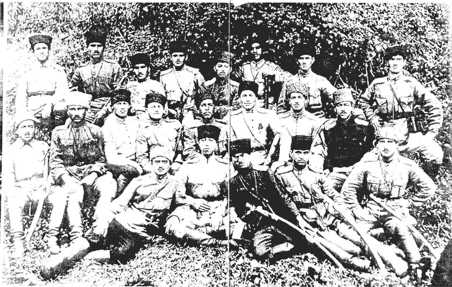
Солдаты и офицеры азербайджанской армии. 1918-1920 гг.