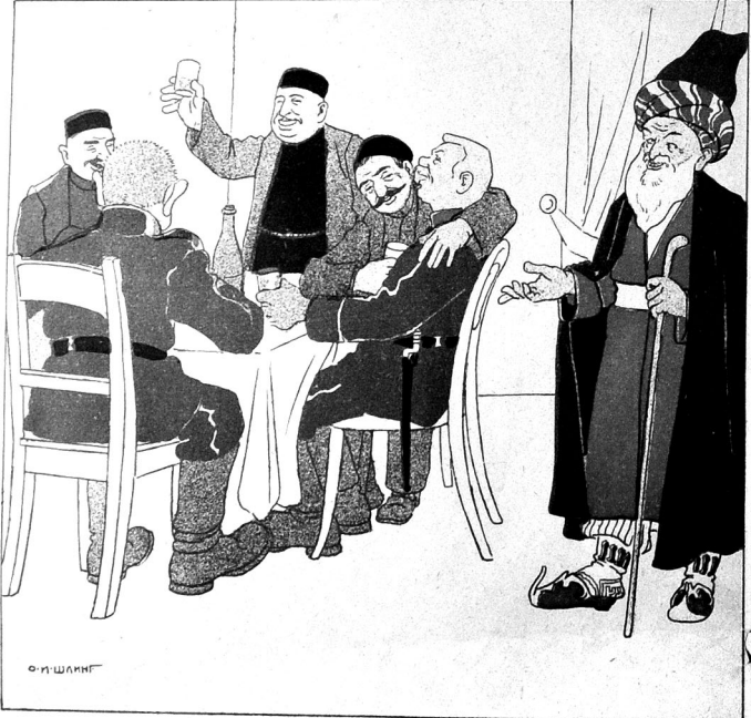
قریان اولسون گانم جانم آقا سالات!