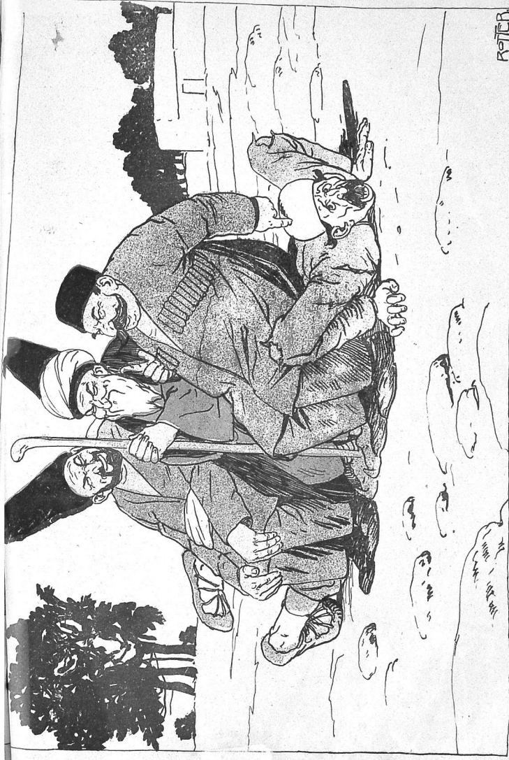
بوی کله اطاعت واجب