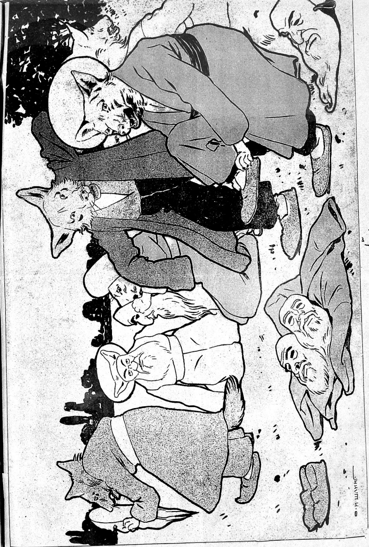
ادب کی پردہ