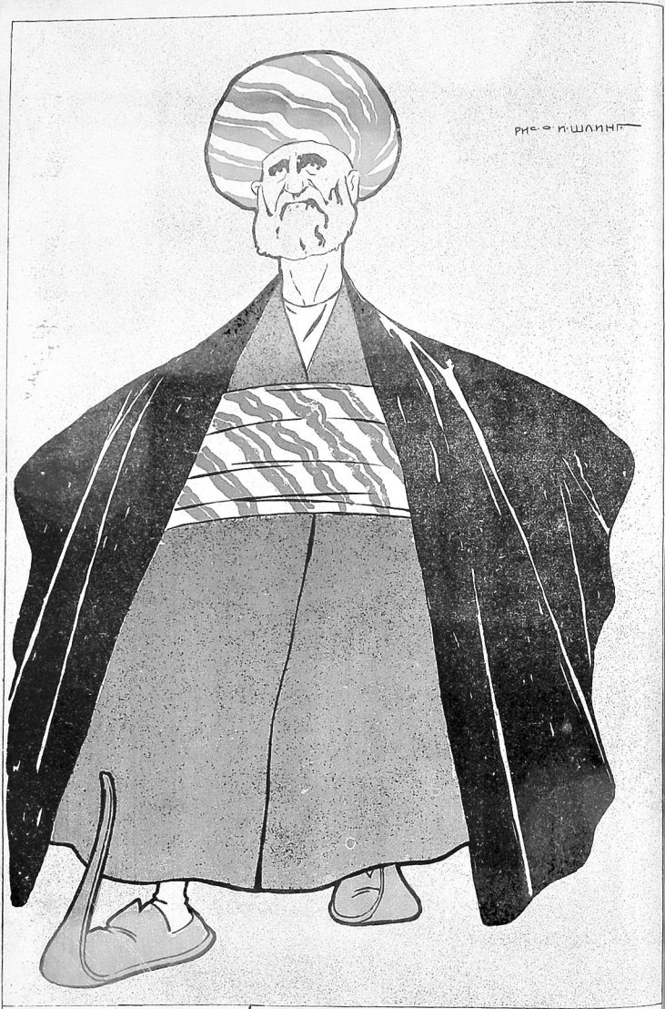
طفل پشناد ساله حاجی خمای .