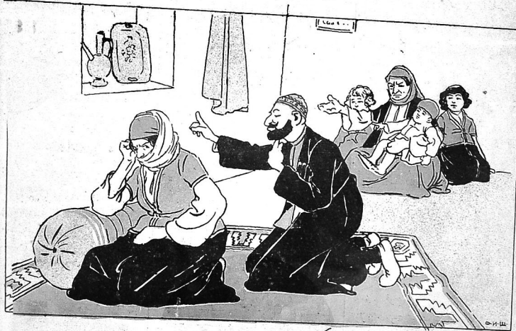
اسماخ ادغوللاری قیز قاجیرماغی لهنر حساب ایدرک، دورت اوشاخ آنا سندن خبر لری یونخ