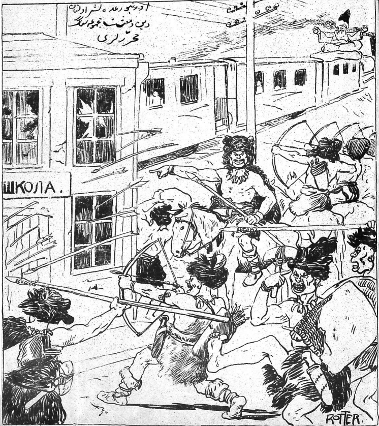
ار عتیق - نوع زماننگ یادگار لاری (روسیه ملانصرالدینک اتفاقاً شریعتاً ضد دور) (دین و منش جموں لنگ)