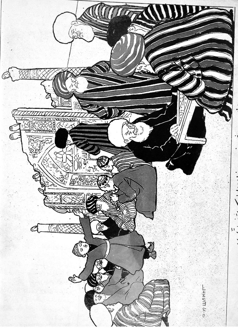
نمای شریفه رضوان الباک مشغولیندی