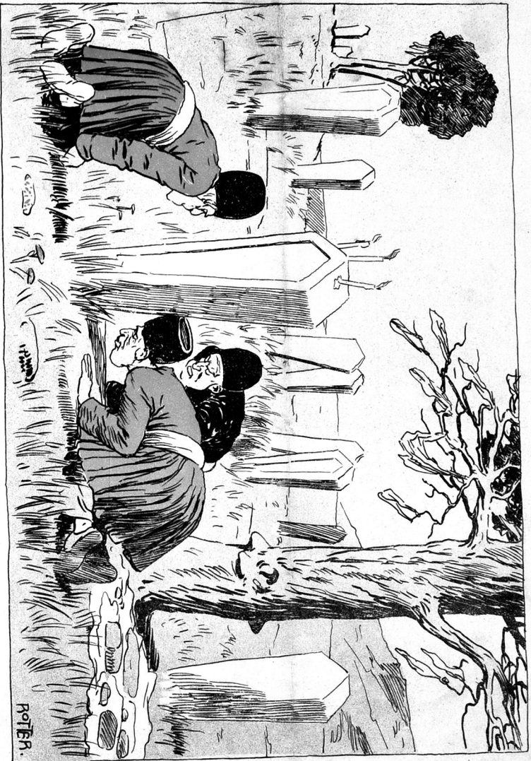
مدد مستردن ا فرشل !