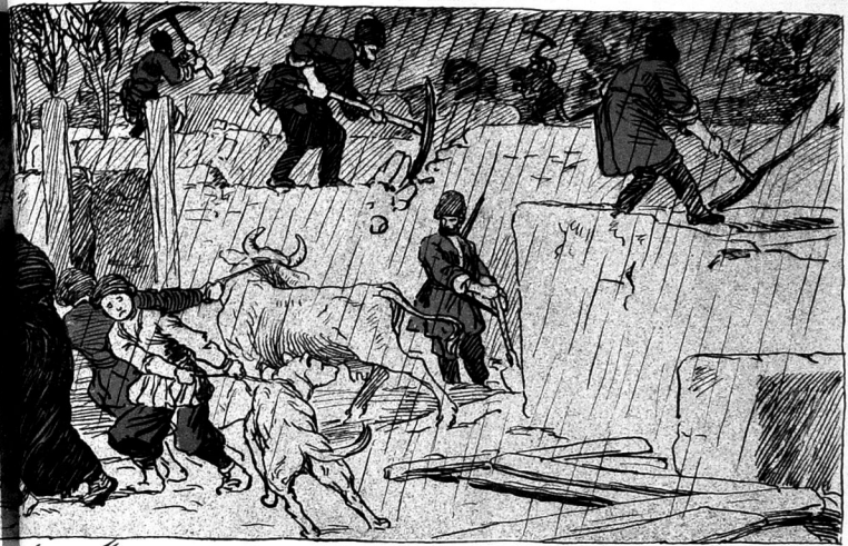
توخماخان گولی، کیلماخی. (ایروانده)