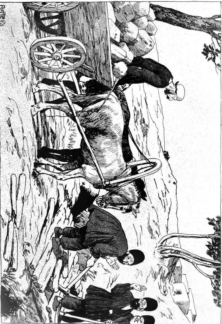
ایروانده سکلانلار کورپنی داغیدرلار کر کلنلب تنبلکه داش دشناسون .....