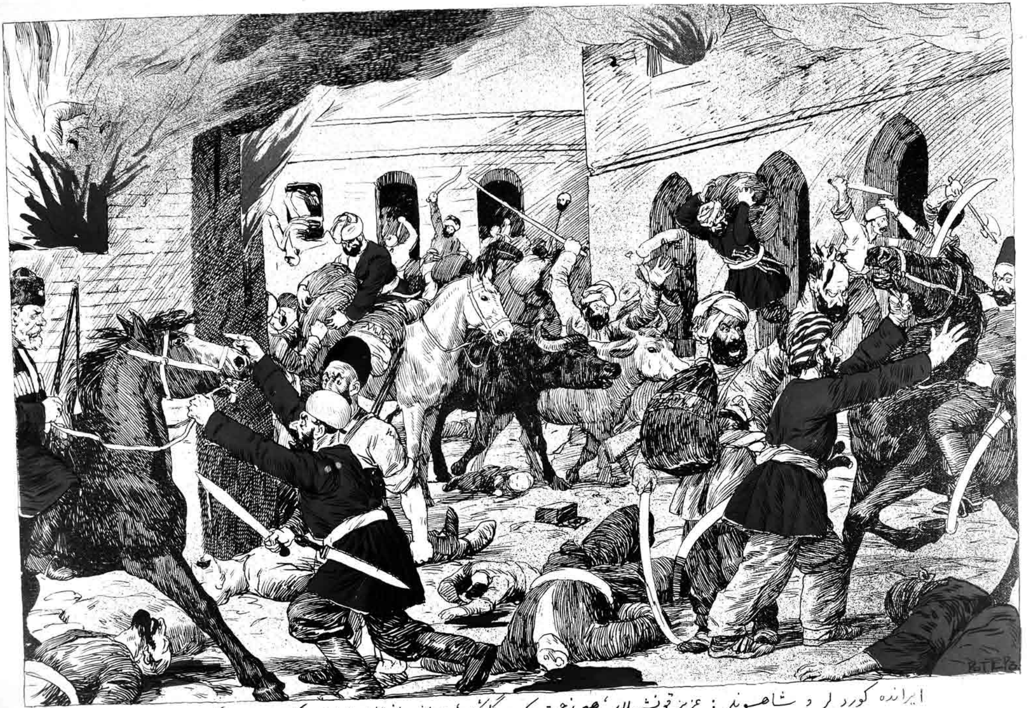
ایراندہ کورد لر د شاصوندر : عزیز قونشی لار ، هیچ زحمت چکوب کلینیز ، ایرانی داغیماغه اوزنمرده کفایت ایده ریکت ....