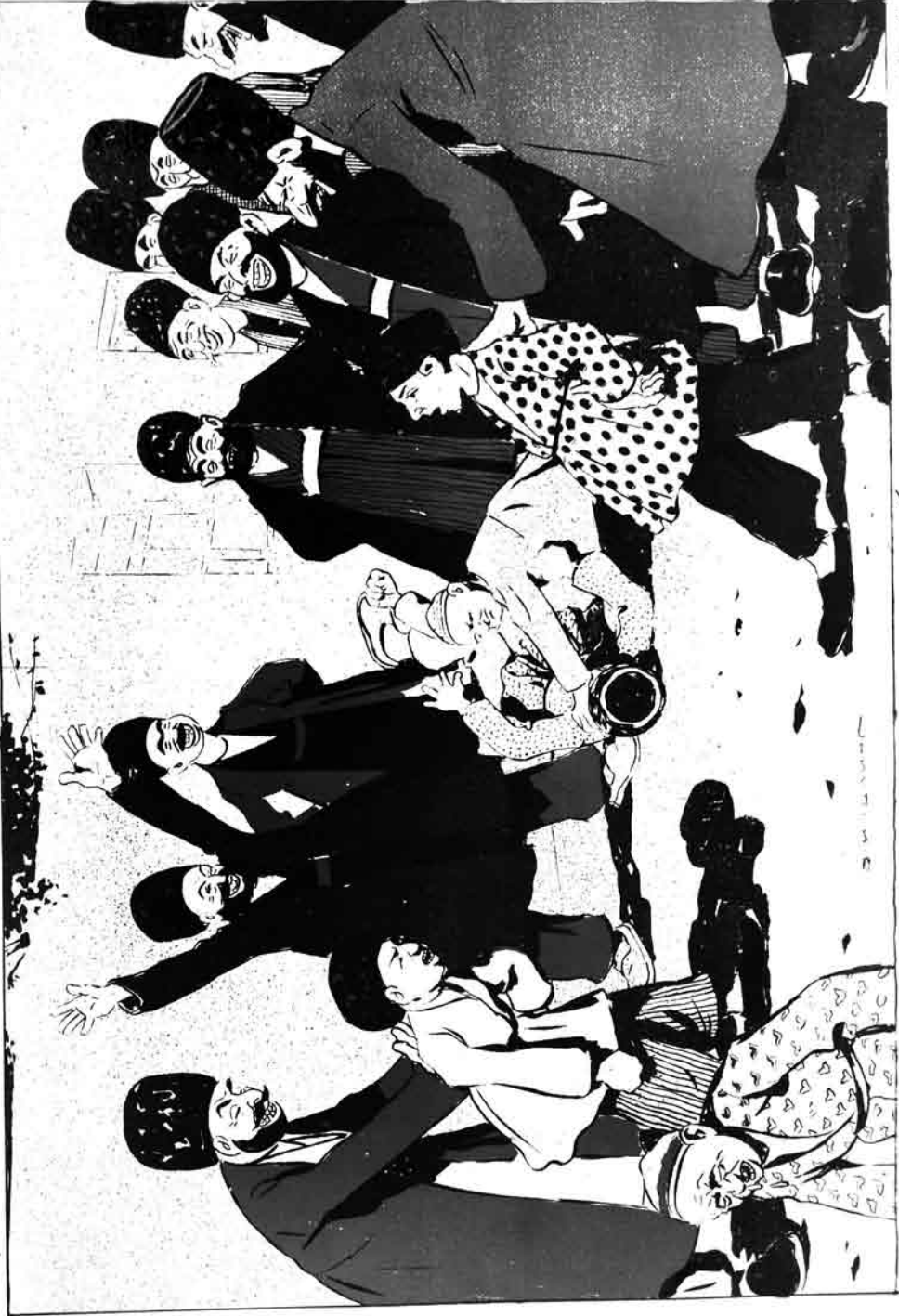
— لمان کو چیرنده ادشاخ تربیہ کی .