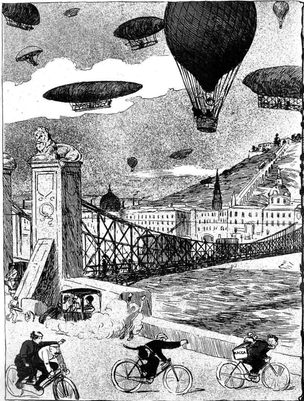
« حلية الشياطين » كتاب بدن