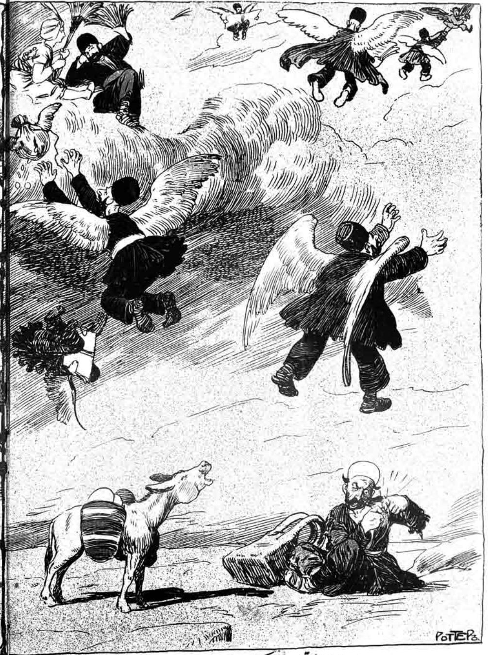
« حلية المتقين » كتاب بدن