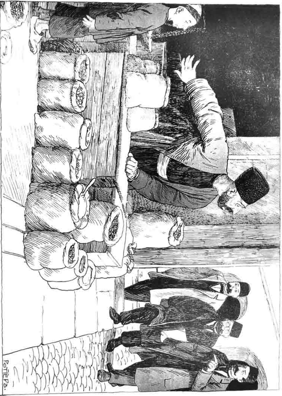
جمعیت خیرہ طرفین وکیل گلزار اعانہ یغافند