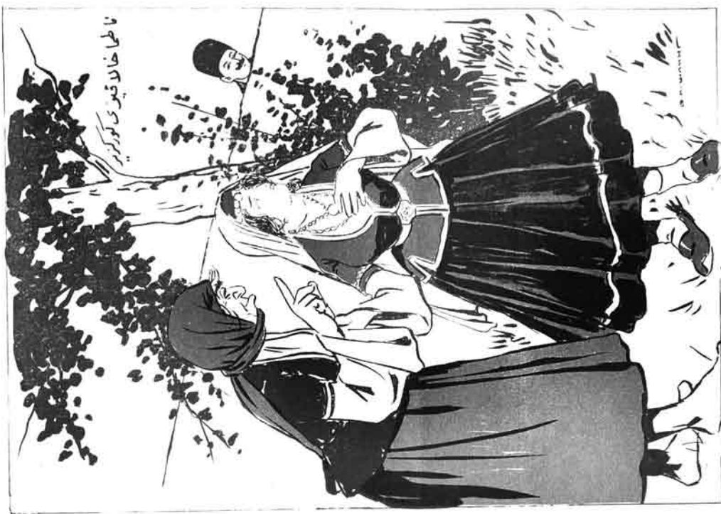
ناطما خالاقیزی گوزل تیزدی