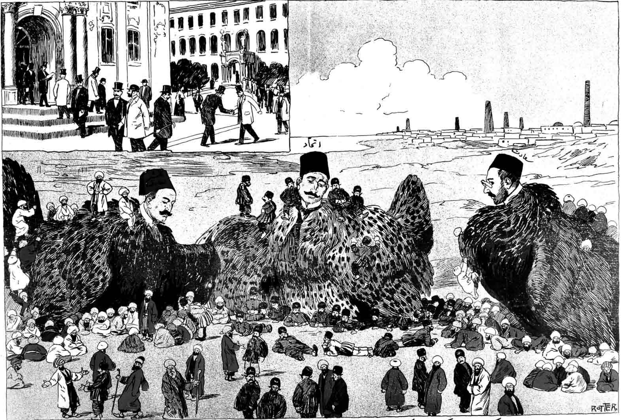
باکوده پاکیزه مکتب لر . (یا اینکه دودت ایل دن سورا سگز یوز ملا)