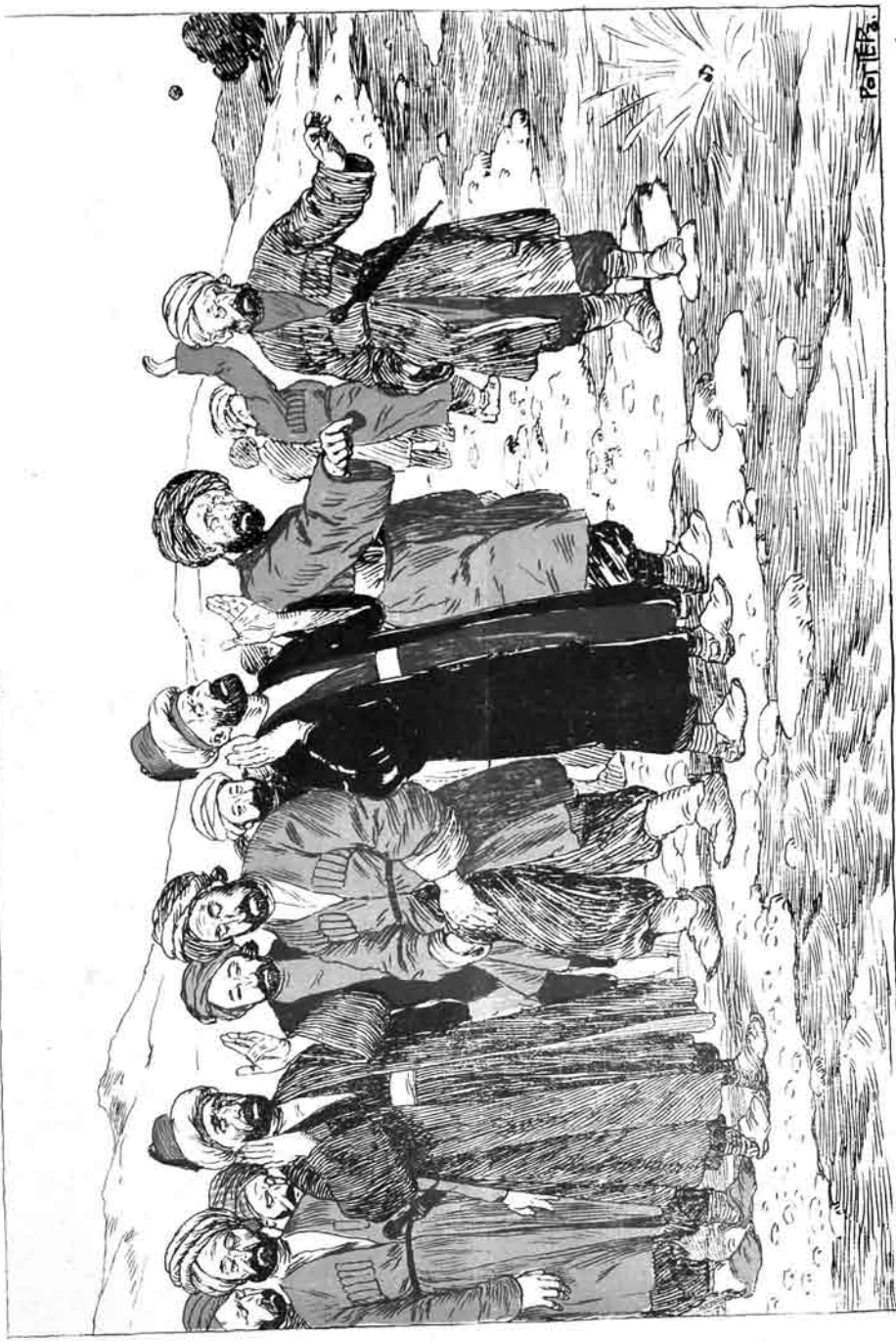
آخالیسینی اویزدنده یانیش یانغیرماق تدبیرلری (قرخ خردا دانکد هر سه قرخ دغه « آلم ترکان الله ... ادخی تو لاسویا )