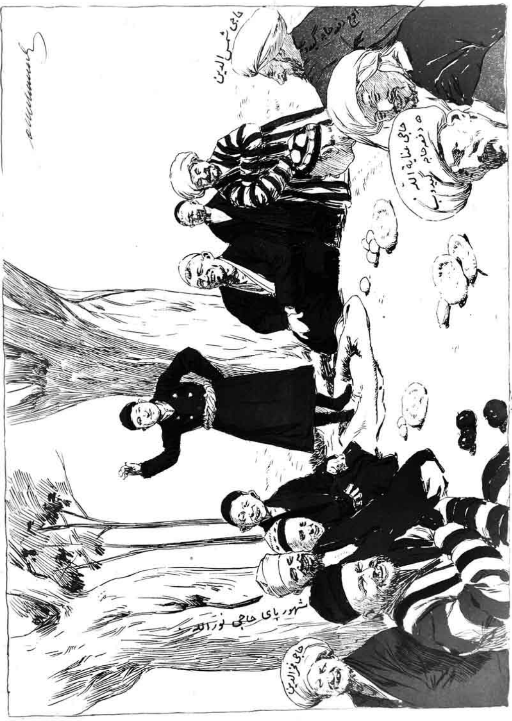
خودقنده سارت اسلاملار بئنگ تياترى