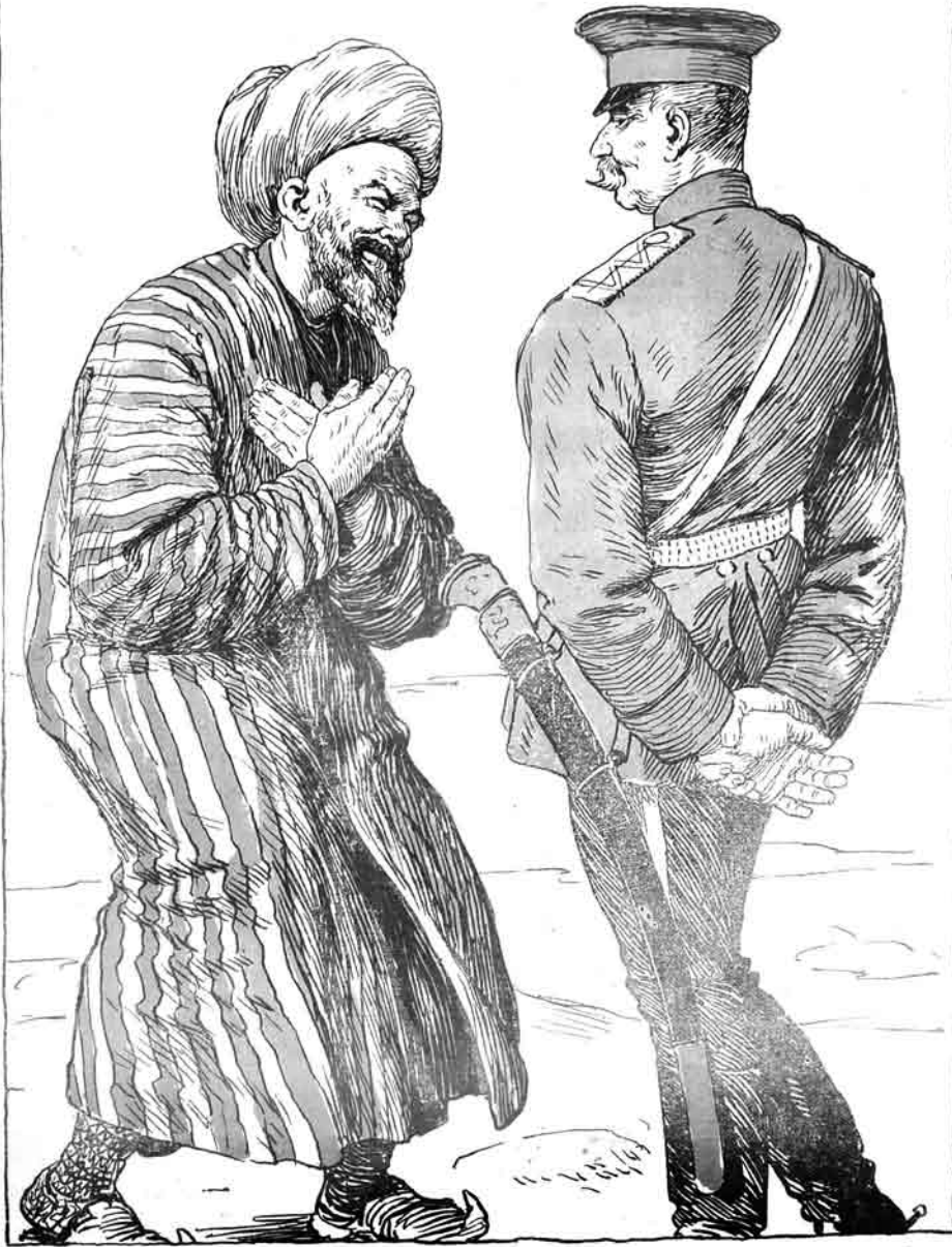
یادہ توسق شہرندہ مدرس حمزہ حضرت غورنا توره سلمان مکتبندن دانوس چیلو ایہ: