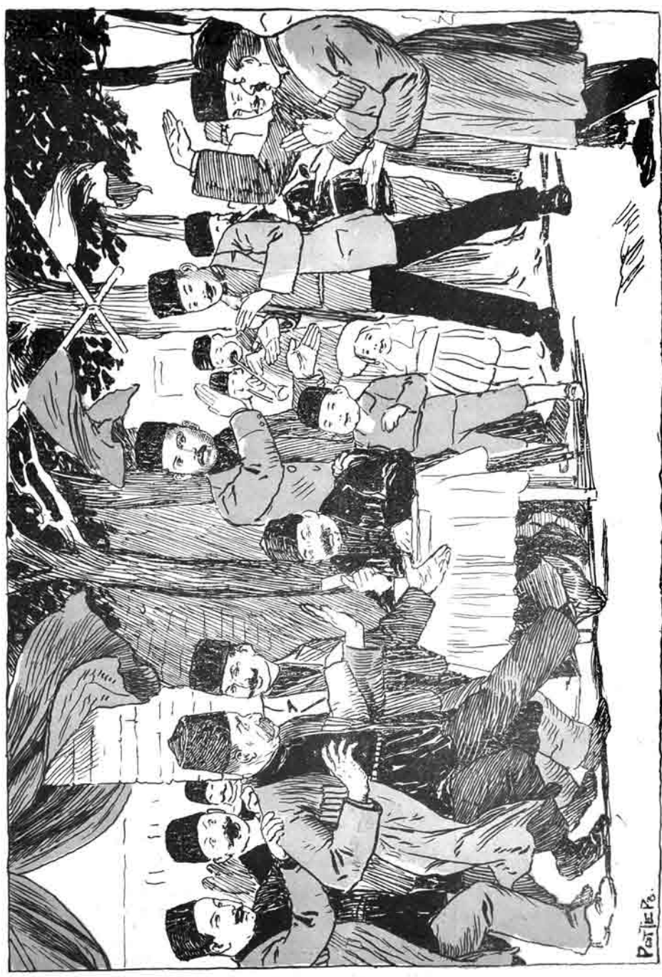
گنجده ده سلمان سیری (قولیانیا) ، گوز لر کور ادا گورسون ، بر آدمنک قولندن دورت آدم توتوب چکده آبار