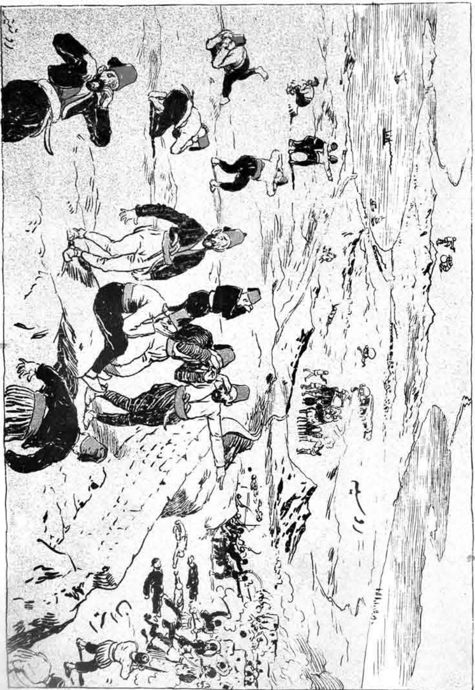
عشاقی لار : او در می قانون اساسی ! بن ابرهتقم انهم