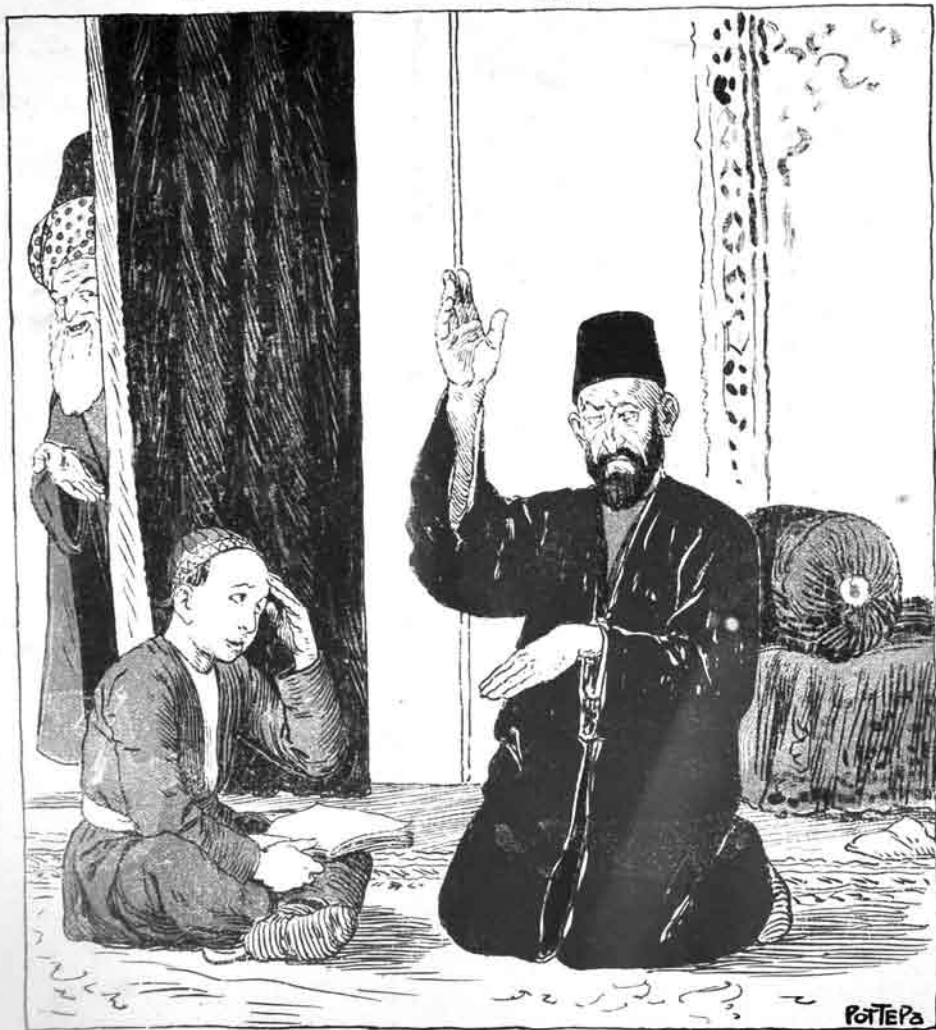
Дитог С. Быхова

۳۰ № ۳۰ قیسی ۱۲ بک موللا ناسریدین اوچوچی ایل