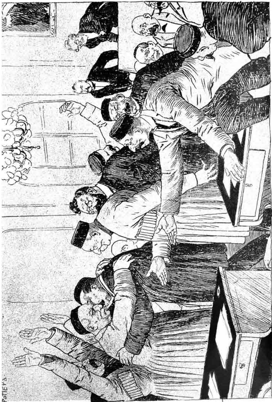
پاکو دو ما سنده تو نفا اجاره داری تک شرط نامه سی مذاکره یہ تو پو لاشدی : بو اشاره بر قیشتوری تو پودی . سو ما مطعم اولدی که بر حاجی تک اولغی اولوب و سلمان عضوری حاجی آرا لینه آلوب چیلیر بر لار : « حاجی سن اولوم بر آل ویر ، اورا اورا اورا ..... (دمدمکی تک مکتوبیندن)