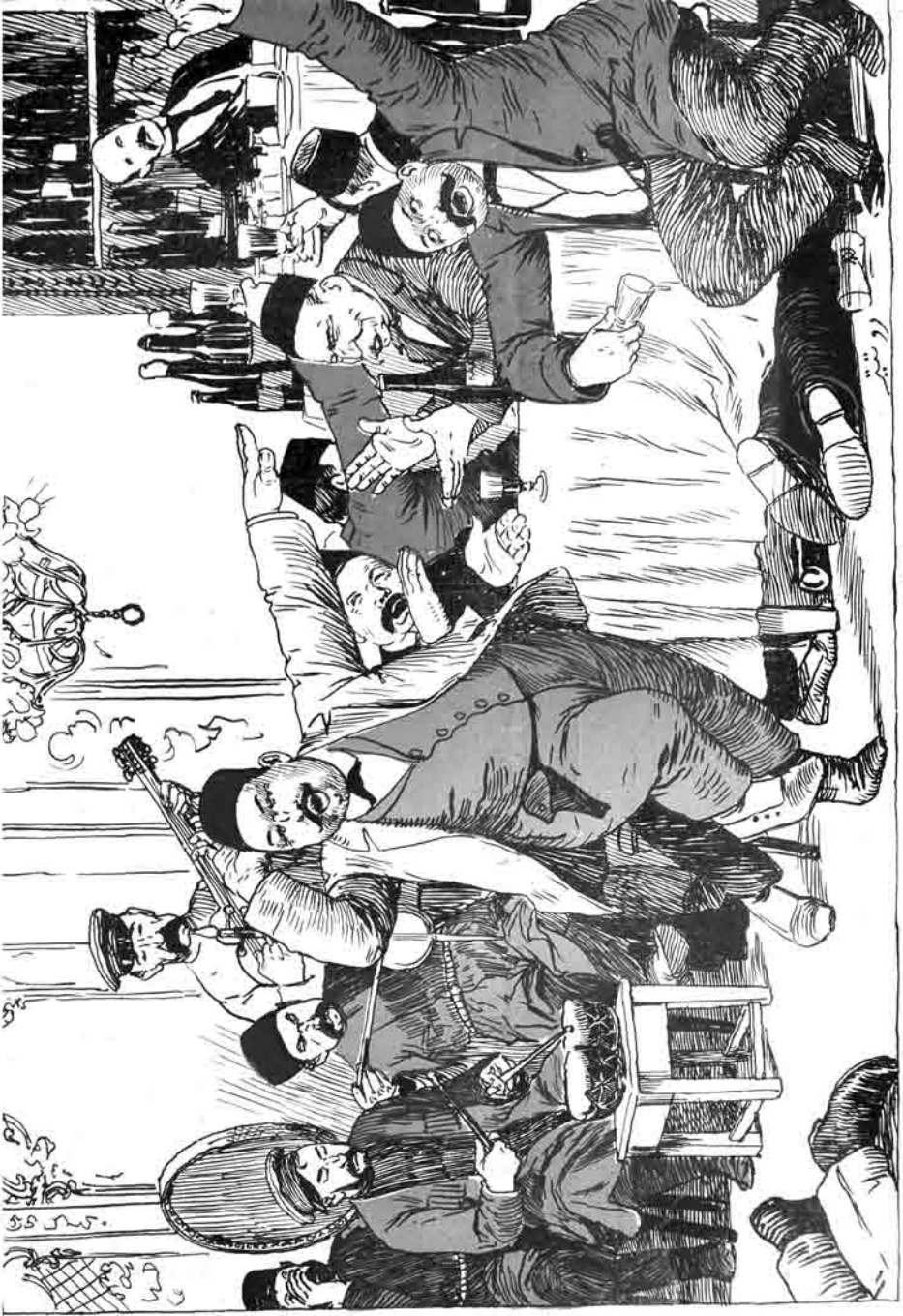
Be kashfi "Apramureccano Obuseciba" (Barry)