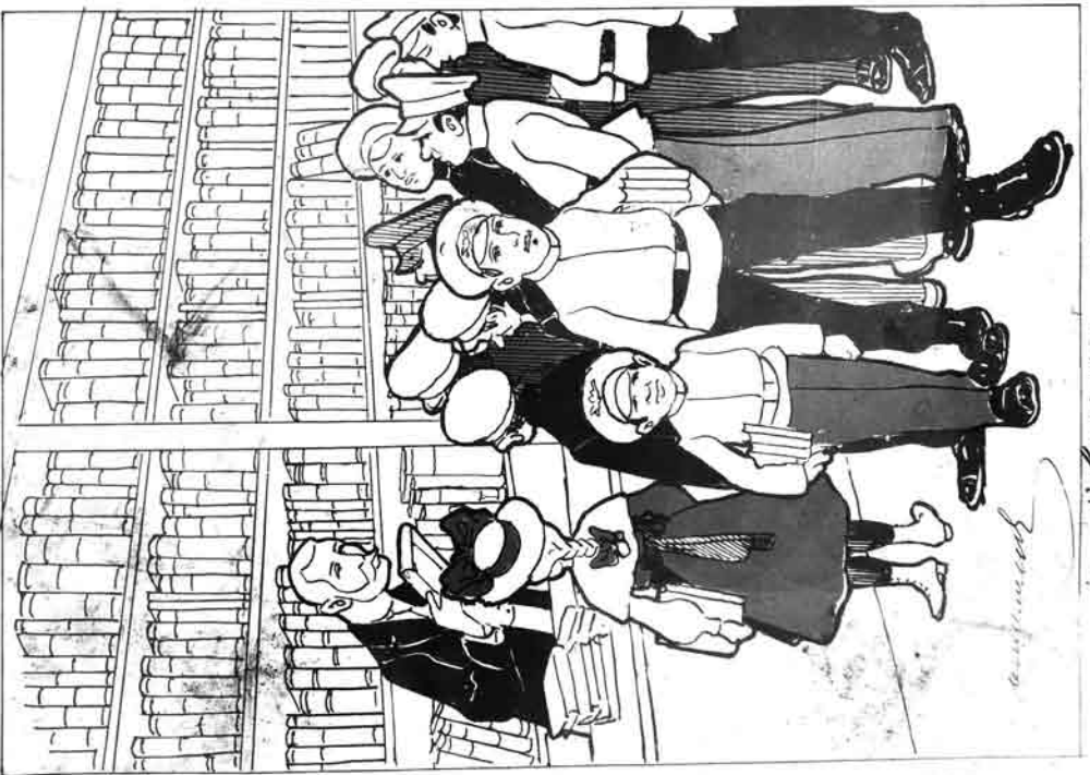
دوسرے باشندگان وقت مسلمان کتابخانہ کی