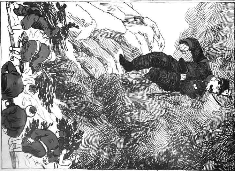
شوک لر : اگر سناده ای لنگ ایلدی جان و شهر لری یا ندر بروب بوچ چچاره دانق — کن تو تاقدر سملکتر دن یخوب آنبه چکل