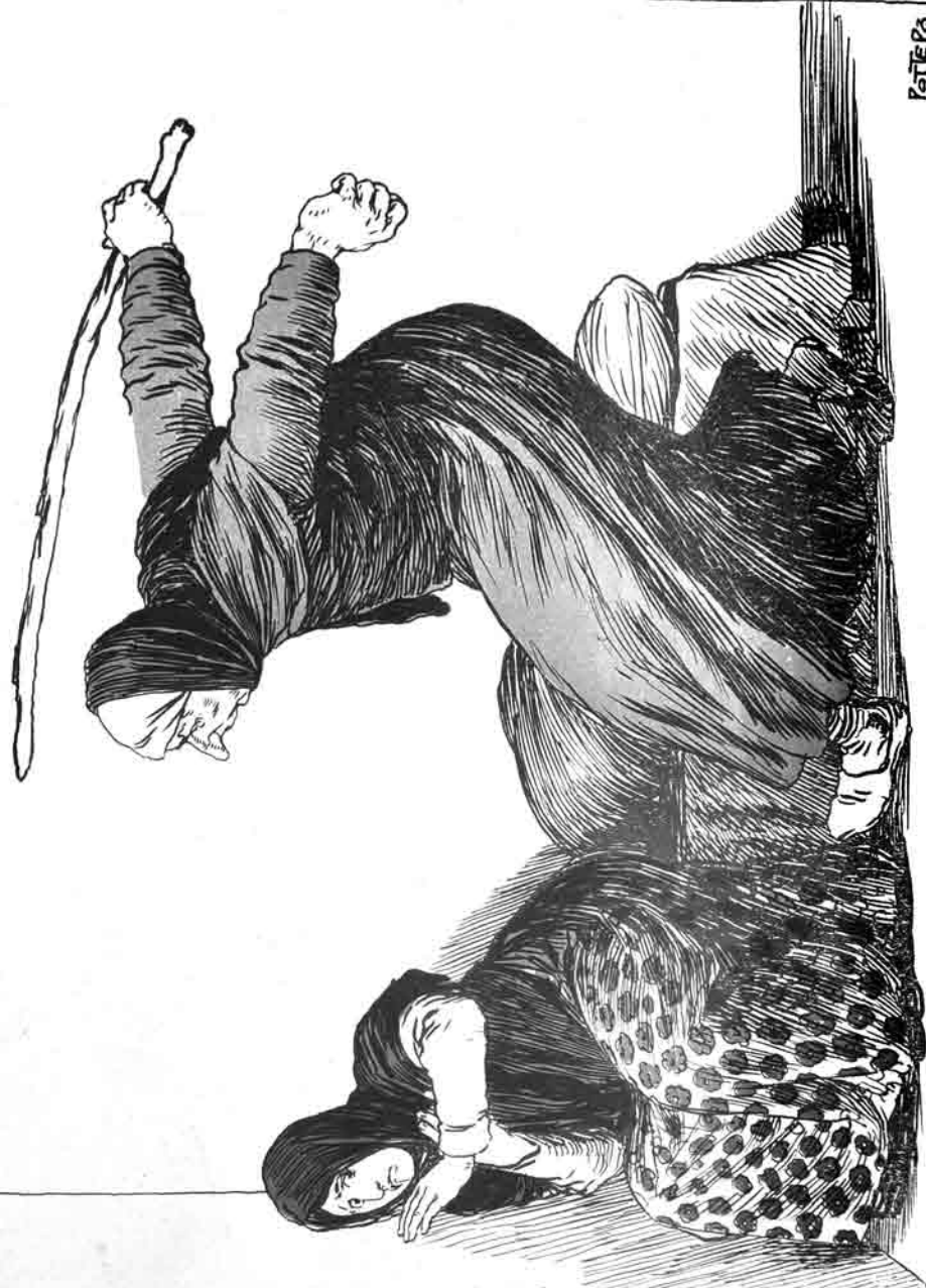
... به حیا قیزی به حیا ، کیم سخا اذن ویردی یا لقوز چخاسان باغچه به ... (بو بولک سوزی : « قیزی ددگیس ویزینی درگرت »)