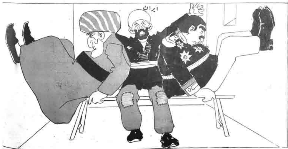
الحکم لمن غلب — حکم و یا شامان گوجلو تک در .