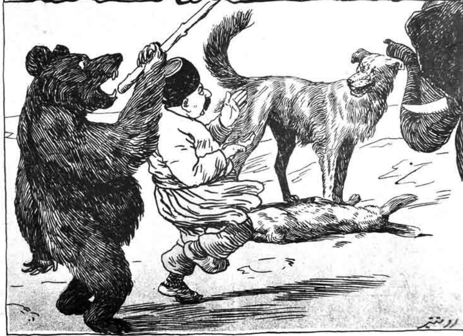
هیچ اوزد مزده باشه دوستموریک