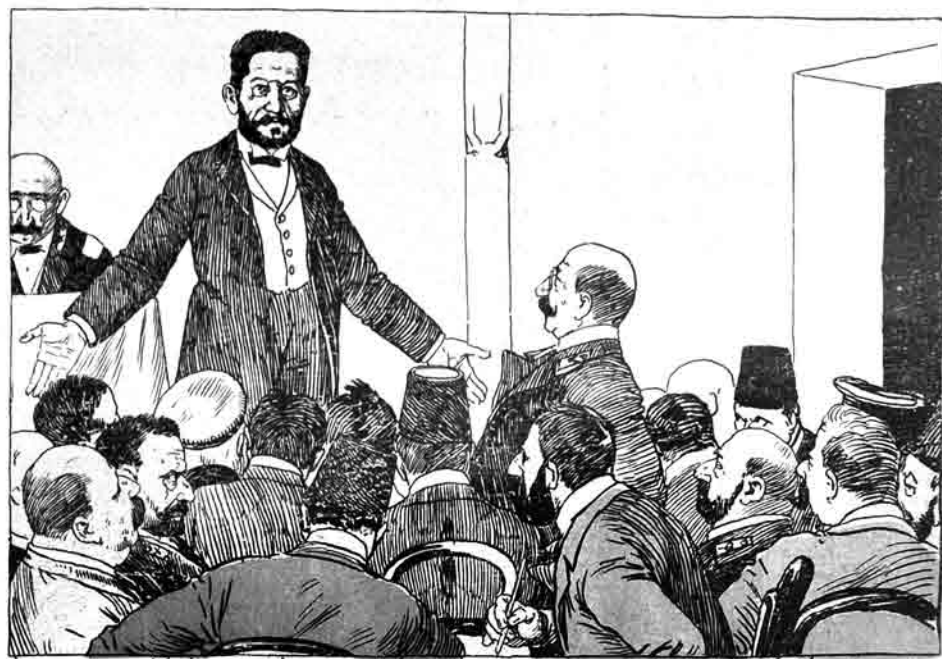
ناطق: جماعت من تکلیف ایلدورم که های مسلمان جمعیتنری پیغمبرسونلار نجات بشیمیتی تک باشنه

آل ماشینا لاری ۲۵ مناته د بوندان یوخاری ماغازه نشانی روسیه تک هر شهرینده ماغازه لری وار