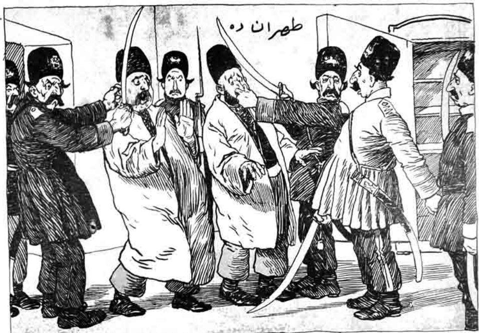
سز شروط طرفدار سز: یارک هرگز آلی بین تومان دیره سز یارک بورون قولانگیر کید.