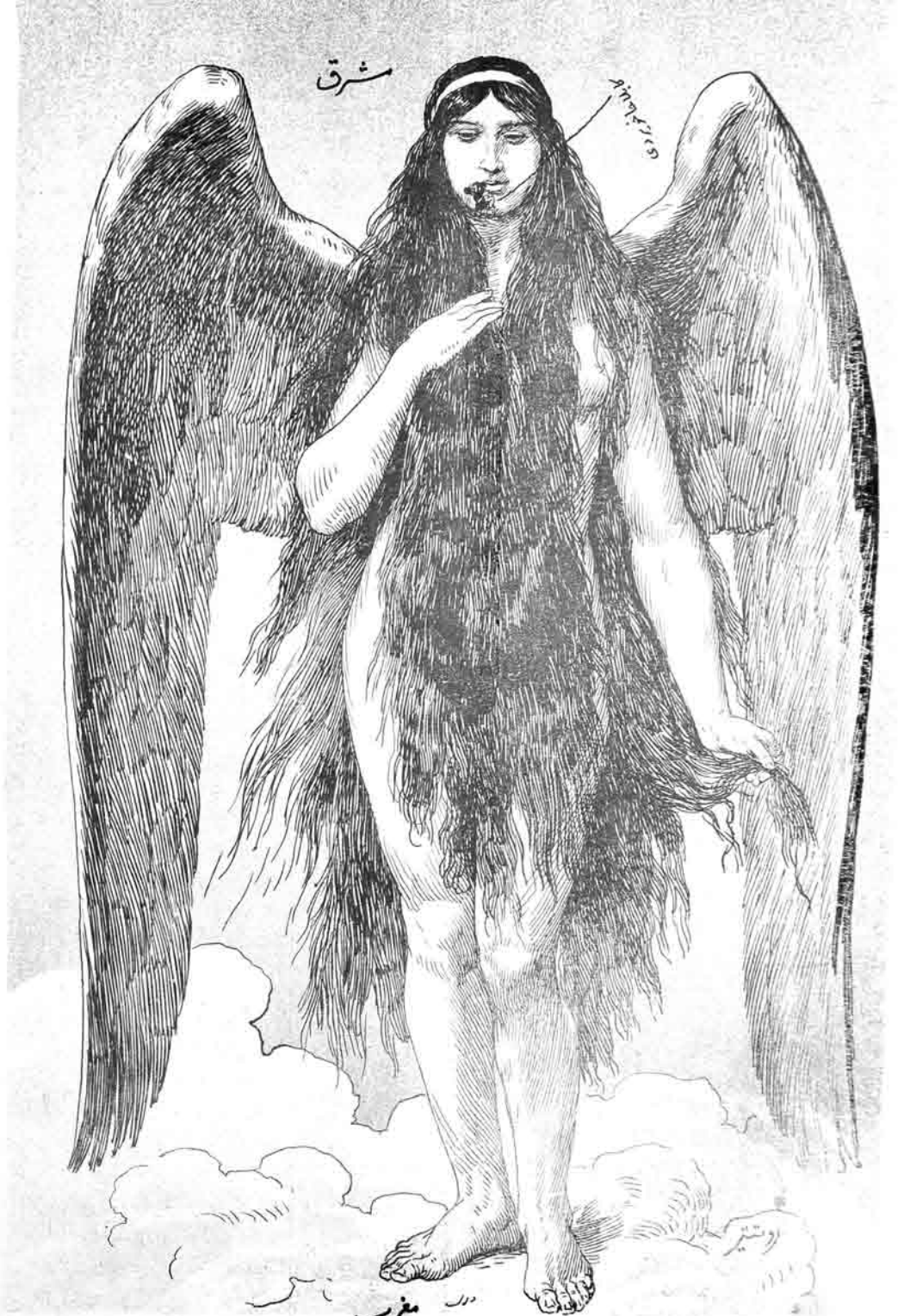
کابل حاخو بردی به باغیشلانان حوری