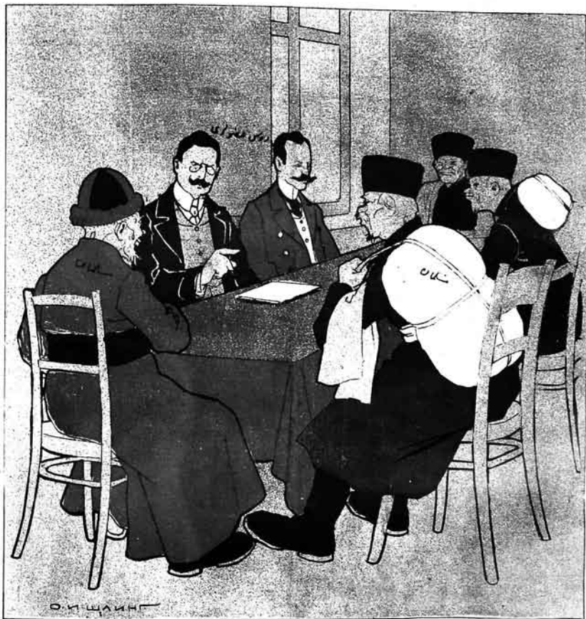
قازان شهرنده دو ما عضوری .