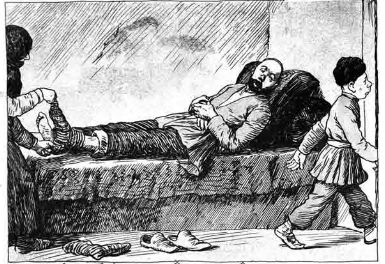
بالا دورماگیت ایشلمگ (مشکی ده)