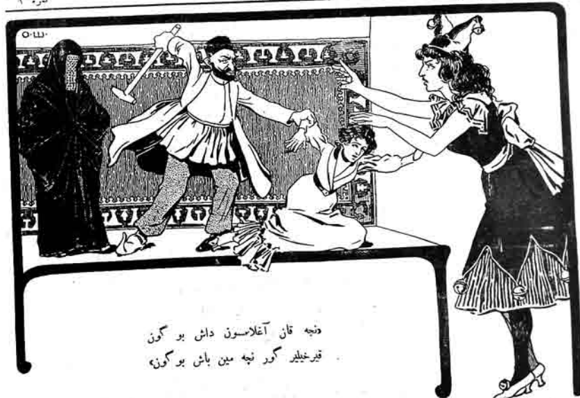
دنج قان آغلاسون داش بو گون قيرخيلير گور نجه مين باش بو گون

بلي، باشلار باشليولار قيرخيلاشنه. ددلاک دکانلارنده مجال يوخدر. عاشورا گوني ايکي يوز يتش ميليون باش ياريلاجان. ولاکن يونلار هابيسي کينه سوزدر. اما يوراده بر مطلب وار که بلکه اوخوجيلارمز اوني ايشتمهش اولا. بو بارده لازم بيليريك برس آز دايشاق. بر يوزنده غريبه بر احوالات باش ورنده يورود. بانگ قتي جيميلري چوخ خربلر چکوب آداسلار گوندريولر که تازه وقوعاتي علم و فن طرفينده اوگرتسون و سورا جسيه عرض ايلهسون بيلهکن يوروياده علم و فن ترقی ايلبون. متلاه آيريتانگ فلان شهرنده گون تماماً توتو- لاجان. قاده همان شهره هر ملکاتک جغرافيا جमित لرتمن دسته عالم لر گوندريولر که کونگ توتول. ماتي سرلري دهخي ياخشي اوگرتسونلر. مثلا ايتالياده