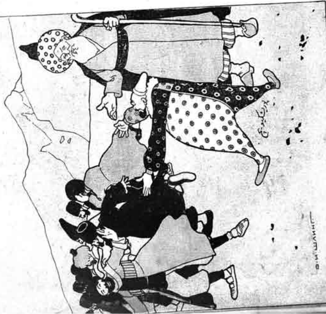
پدری کیجوج : صداتی تانماز سلاسی برکک بوج ایستیکوک ... (الله بد نظر دون سافکویا)