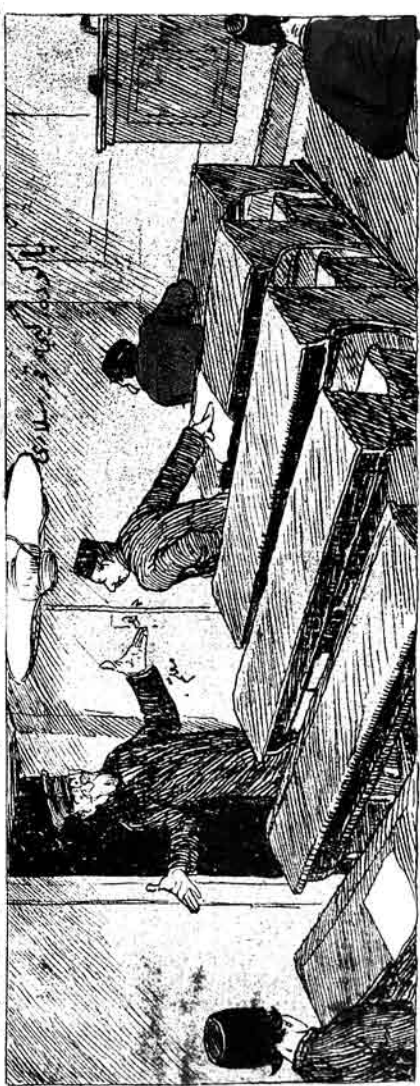
آبایم ! ایکی یوزدن ایلم برجت بر تک !