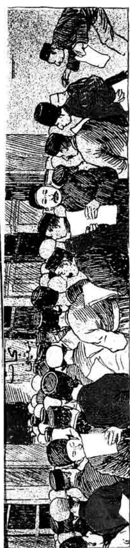
پرواوردینق ایستین کی پرواوردینق قیامت چیتدندون قوتوغ اسیریک کر بره بز تک من کیچه قورسلاوری آچیلورون و هئای قیخاری بیینیمه کیریک .

برداشتده، قشونک گورلگمه، و راحت گیلتده، برنجی امر قوتوللان. عکاشلاری آجیبی لار اولاری لشدیق اسرجدار.