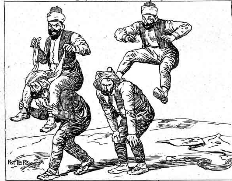
باطوم ده آچارا مالئنه ملالار و رعیت Милли в Тамбовской области.