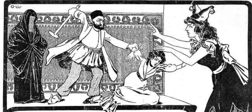
نوروز بايرنامه مرتب لریمز ايشله مديکاري سيندن مجموعه سي ايکي گون يوباندي.