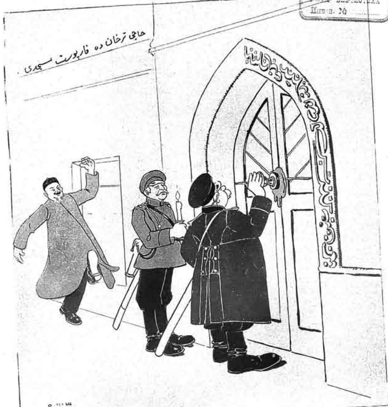
جلالی حاجی افندی : سز منی ملا ایلمه دیکیز - من ده شکایت ایلدم که منم مسجدیمده مسلمانلار مندن اذن سز نماز قیلملار

۱۳ ۳۹ فقط ۱۲ کبک کتابخانه مرکزی جمهوری اسلامی ایران شاره بهارستان شماره ۲۹