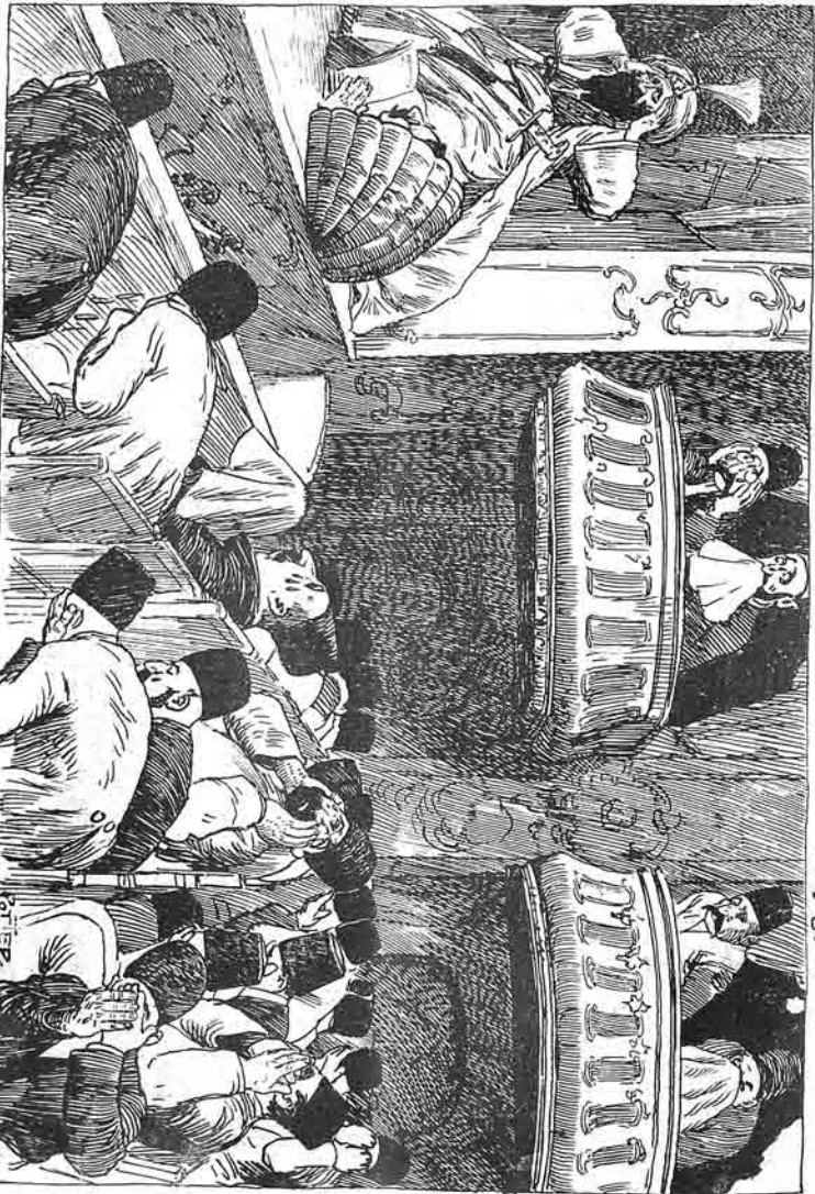
تقلی تازنده قاجم اویزلی

بشر بورغ ده مالک باخشى لفته ضمانت ایدیریک. هر یرده ساتیلیر.