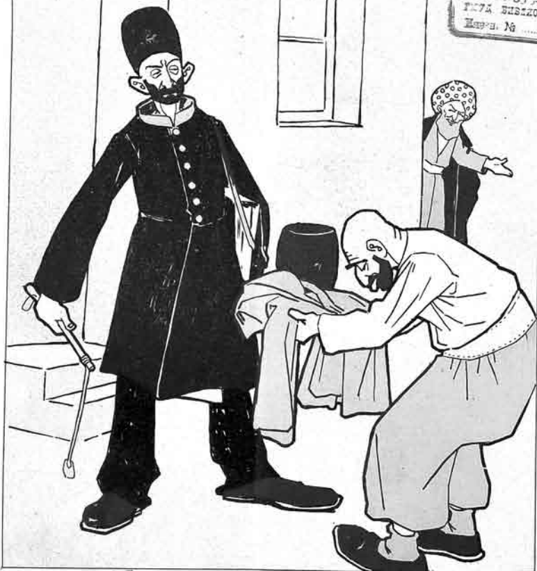
خان — یا بختارت مکا یاریم منات دیر، یوسفه سنی آپار رام نایب سندن بش منات آلا ر رعیت — باشکا دونوم خان، آنجان رحیم خانک قرقینندن یاخای تورنادوب قاچهمام، بو در

СЕРВЕЗДЕ. ЦЕНТР. تهرانی خان مرکزی دولت کتابخانه شماره ۱۵