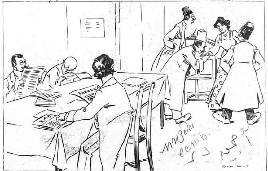
شهر اوراداسی قزاقان خانیه مگن کردن توقع ایبر کر غازیبه Объявление от с. Ордави: просим