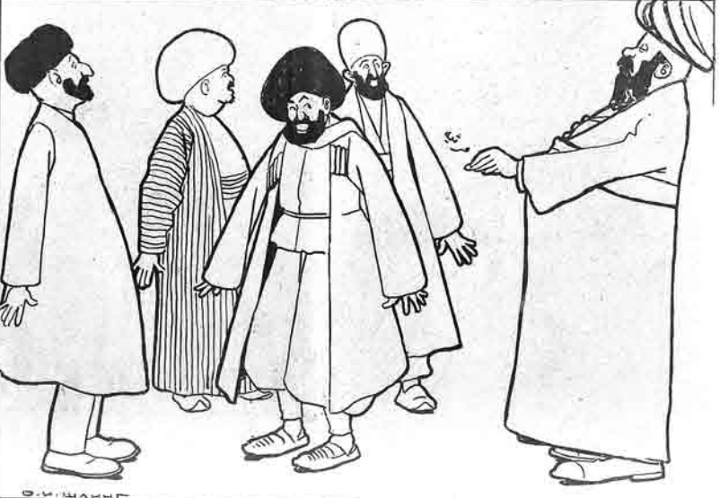
آی آخوند بز سینه بر کوک قاز و پر دیک سزده هیچ اولما سا بزه ادنک پومورنا سینی و پروژ