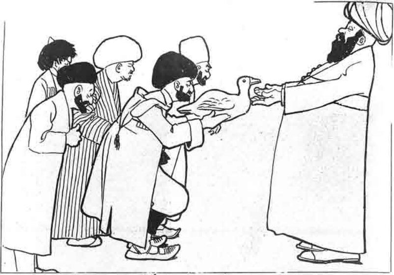
مسلمانلارک تبغه لک دیگی سی

ЦЕНА на ГОДЪ: Съ доставкой . . . . . 5 руб. За границу . . . . . 8 руб. ЦЕНА за ОБЪЯВЛЕНІЯ: За мѣсто замѣномъ строенъ погита впереди текста 10 коп. пошла . . . . . 7 коп.